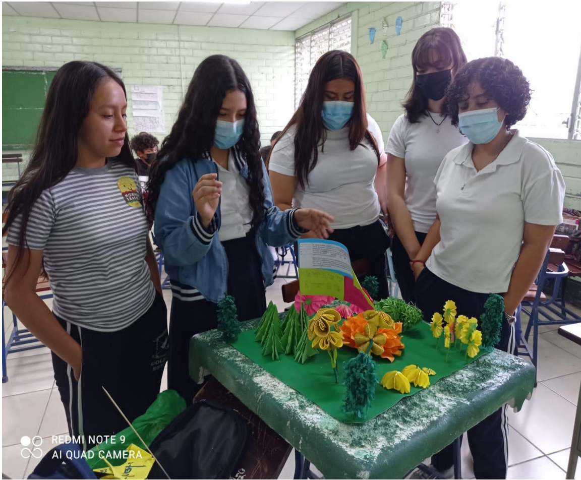
Actividad final, entrega de todas las actividades