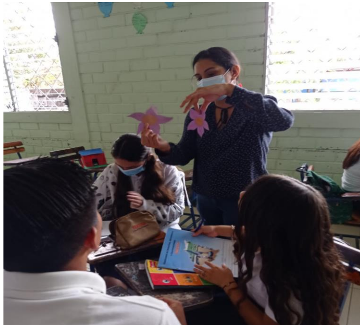
Complementación de actividades para desarrollo «El Jardín del conocimiento»