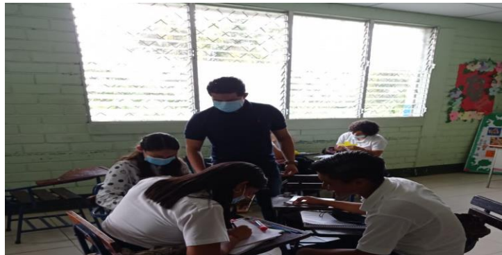
Supervisión y revisión de las actividades dentro de la estrategia “El jardín del conocimiento”