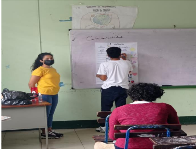
Clase práctica, análisis de las categorías gramaticales.