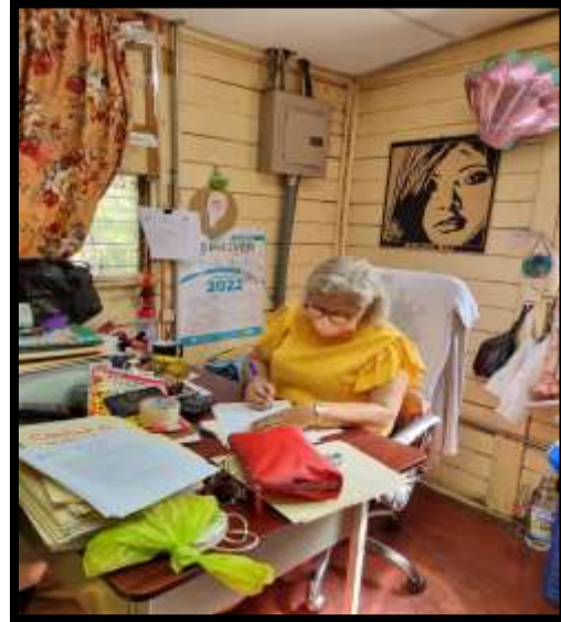
Entrevista a directora del Centro de Aplicación Arlen Siu