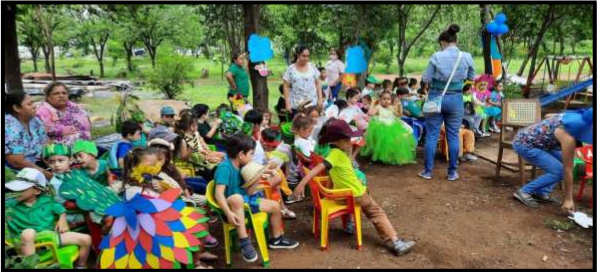
Niños de tercer nivel durante actividades artísticas del centro