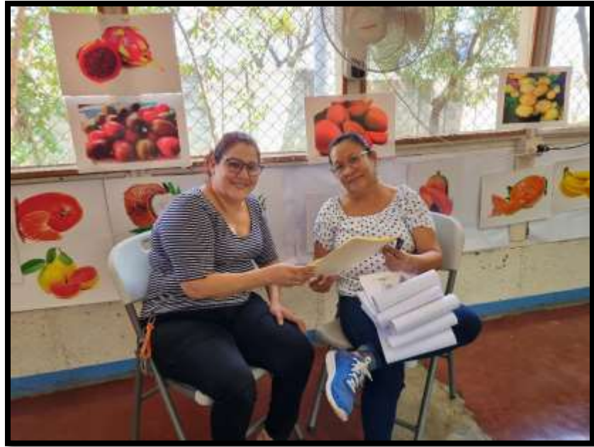
Entrevista a Maestra 1 de III nivel