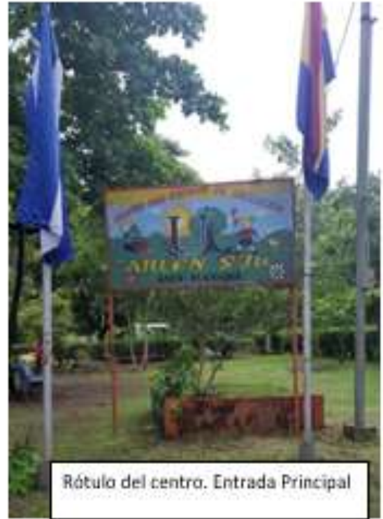
Rótulo del centro. Entrada Principal