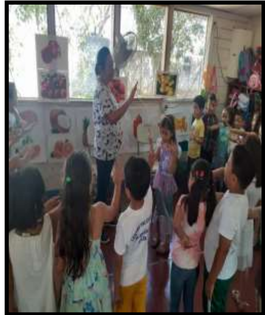
Niños de tercer realizando actividades vinculadas al arte