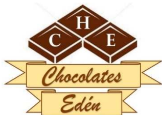
Figura 1. Logo y eslogan de la Empresa Chocolatec Edén, S.A.