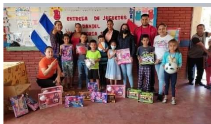
Niños en San Isidro, Entrega de juguetes a niños en navidad.