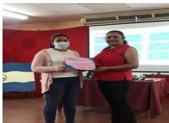
Maestra del Municipio de San Isidro.

La educación es un proceso de socialización y enculturación de las personas, a través del cual se desarrollan capacidades físicas e intelectuales, habilidades, destrezas, técnicas de estudio y formas de comportamiento ordenadas con un fin social Pérez-Cortés, (2002)