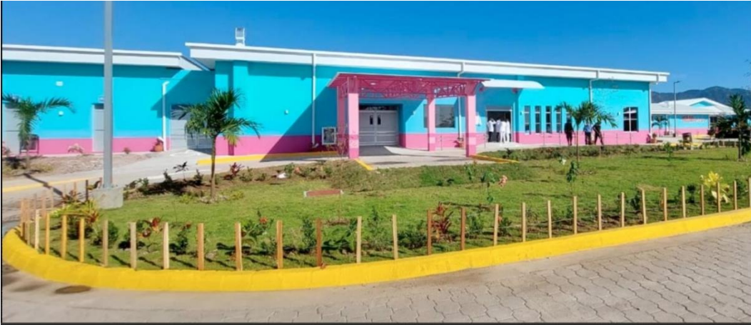
Ilustración 2 Hospital primario del municipio de Matiguas