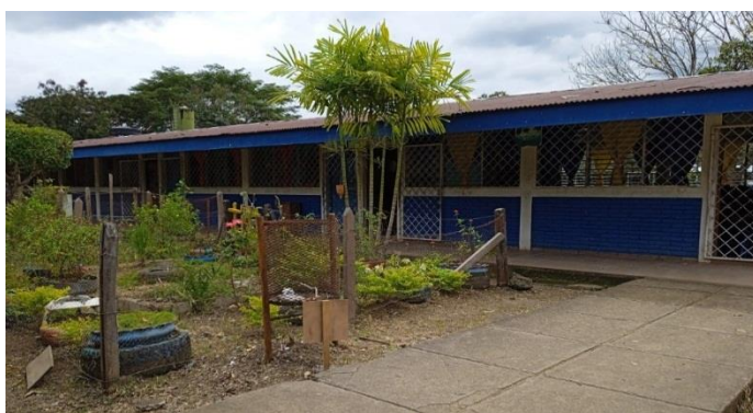
Fotografía de Marvin Huete 2021