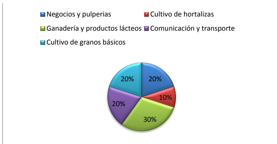
Gráfico 2 Actividades económicas del municipio

Esto refleja que el municipio de Matiguas tiene mayor predominancia con respecto al sector lácteo en comparación a los otros municipios del departamento.