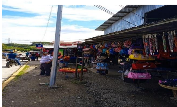
Ilustración 4 Mercado local de Matiguas