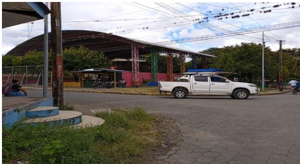
Ilustración 3 Infraestructura vial del municipio.

Estas vías se encuentran en la periferia de la ciudad, al igual que en sectores donde la topografía, o la falta de tratamiento las convierten en vías únicamente peatonales.