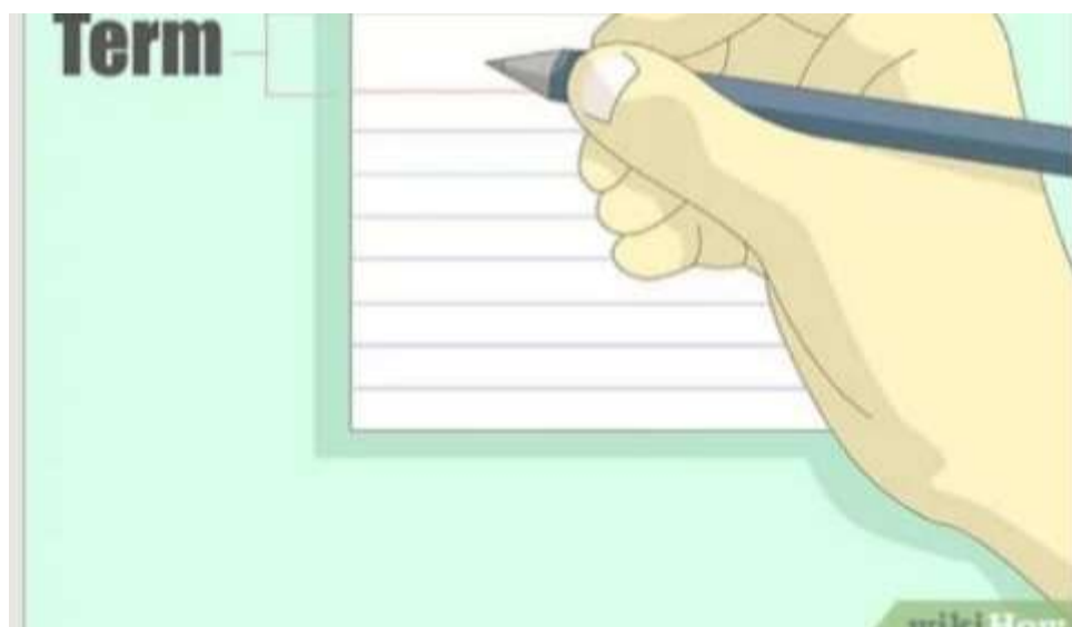
Imagen 3- fichas bibliográficas// http. Es.m.wikihow.com