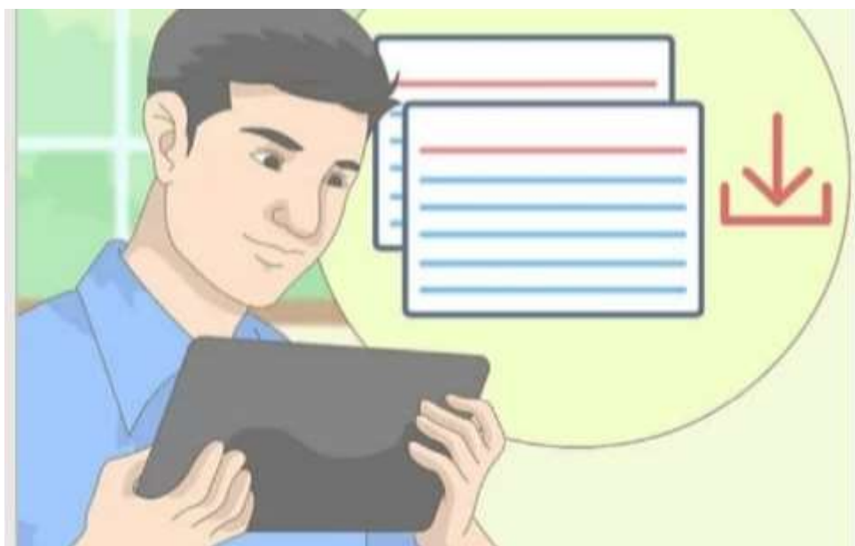
Imagen 7- fichas bibliográficas// http. Es.m.wikihow.com