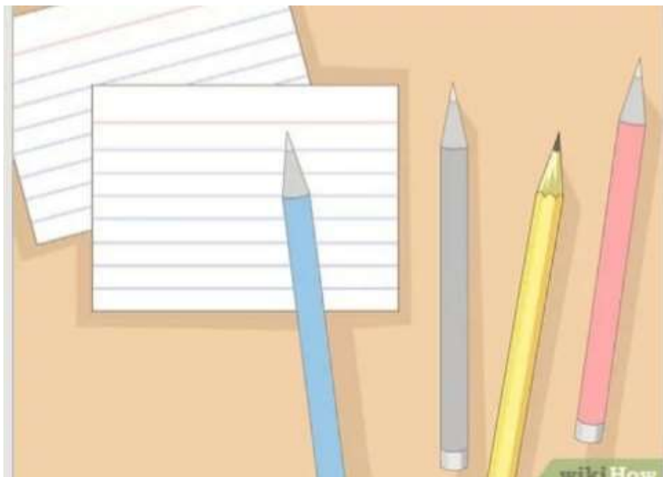
Imagen 2- fichas bibliográficas