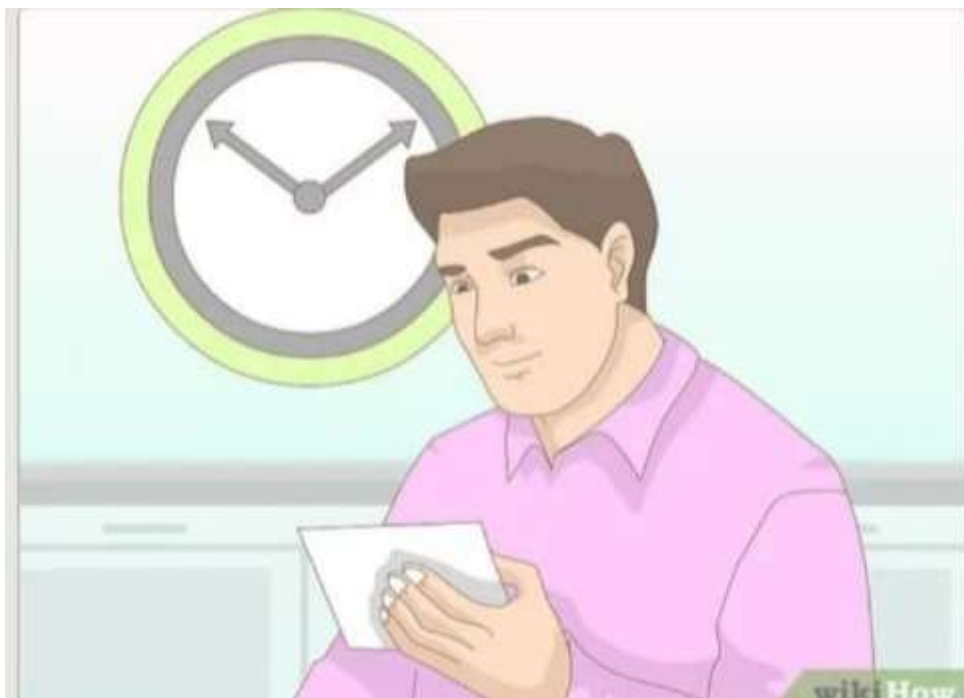
Imagen 6- fichas bibliográficas// http. Es.m.wikihow.com