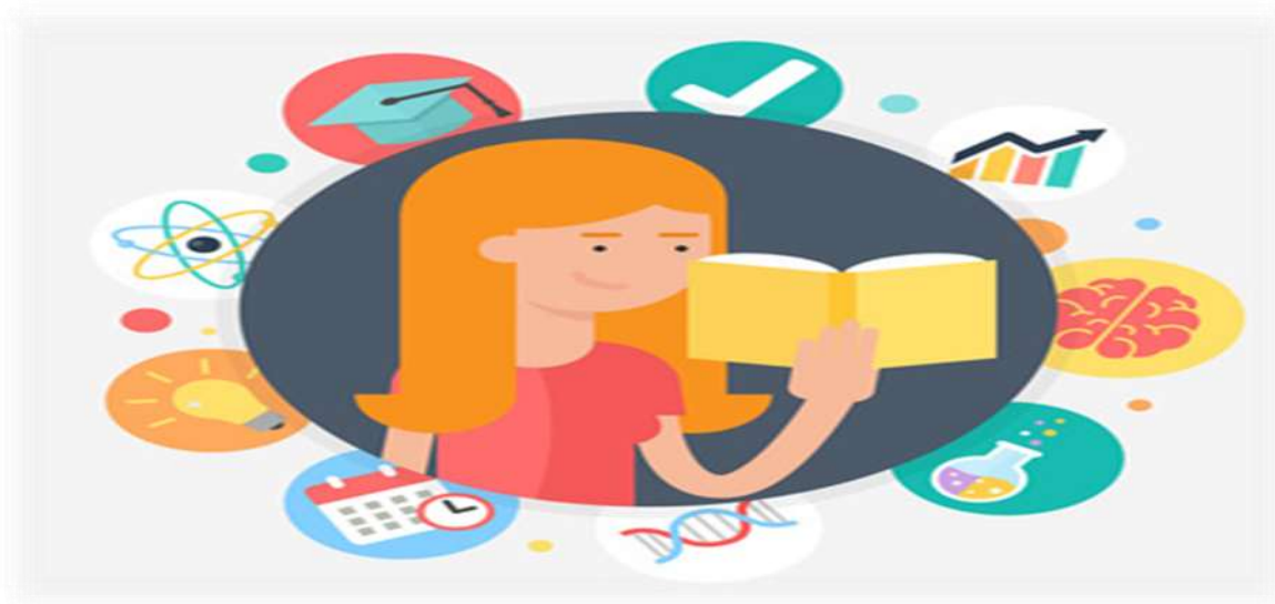
Imagen 1 lectura – internet. http://estrategias-didáctica/tipos-y-técnicas-de-lectura