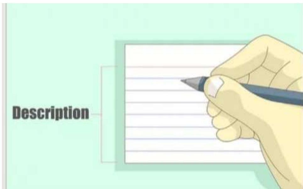
Imagen 4- fichas bibliográficas