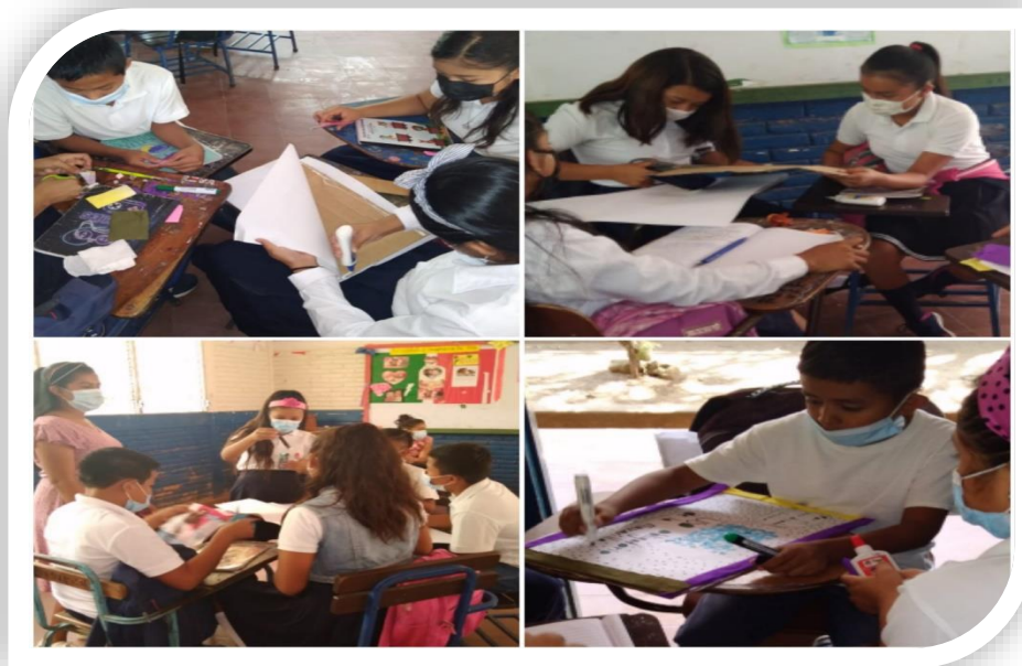
Ilustración 3. Estudiantes elaboran sus collages de acuerdo a la función del lenguaje asignada por los investigadores.