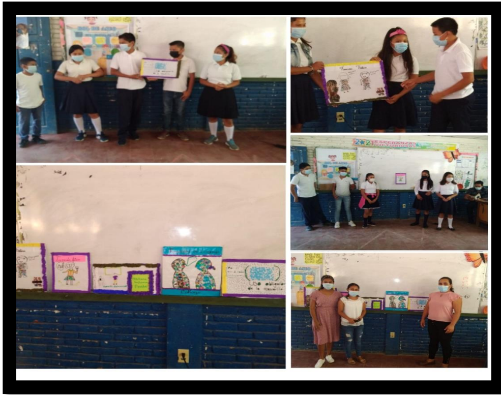
Ilustración 4 estudiantes exponen su collage realizado con la función de lenguaje correspondiente