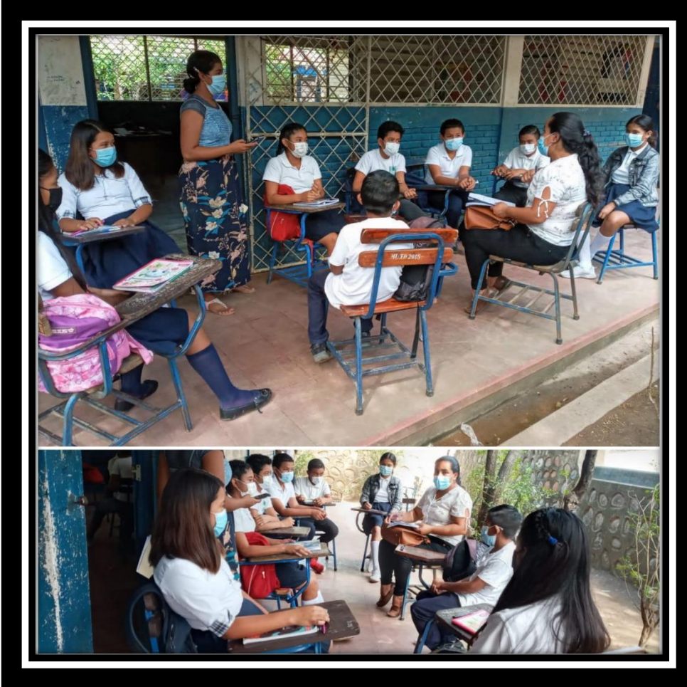
Ilustración 6 Estudiantes participan en el grupo focal