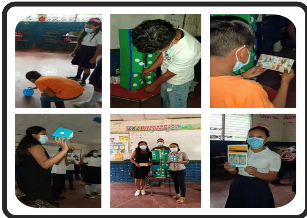
Ilustración 5. Estudiantes participan activamente en la estrategia didáctica "El dado Preguntón".