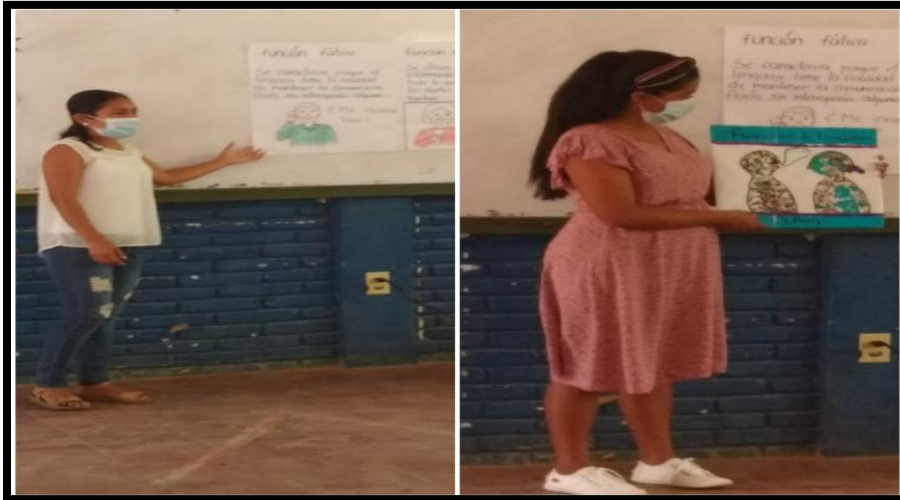
Ilustración 2. Investigadoras dan a conocer a estudiantes de séptimo grado "A" concepto y término de las estrategias "El collage" y "El dado preguntón", así mismo las funciones del lenguaje (fática y referencial).