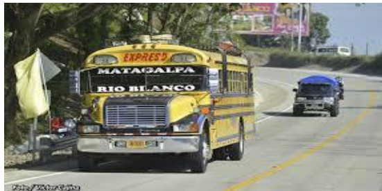
Imagen 4. Bus transporte.