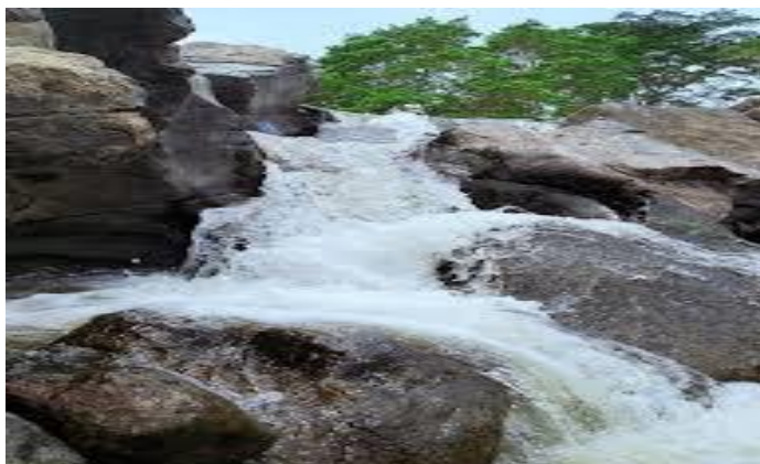
Imagen.7. salto Esquirín.