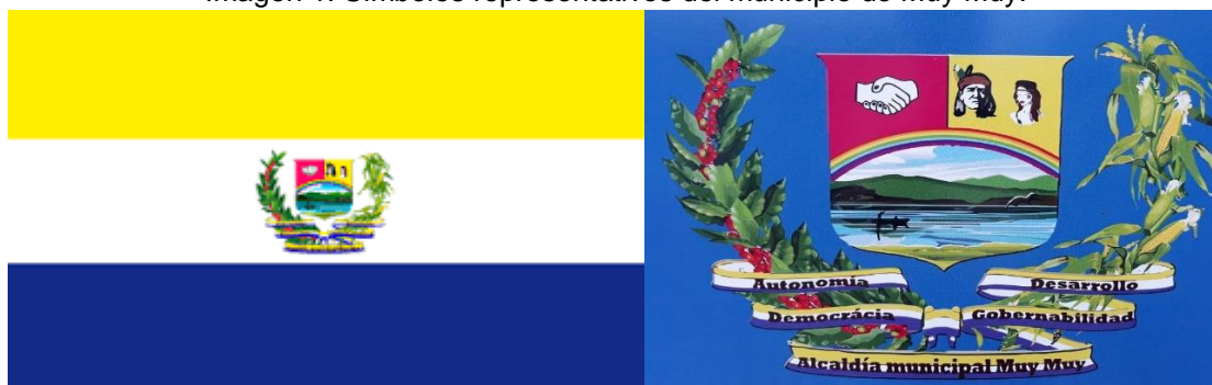
Imagen 1. Símbolos representativos del municipio de Muy Muy.