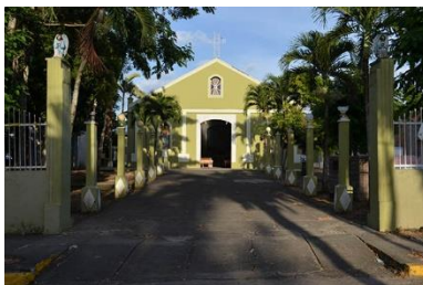
Imagen 3. Iglesia católica Muy Muy.

La primera iglesia de las tres que ha tenido el pueblo, ha demostrado la fe de nuestros padres. En el año 1765, lo testimonia la fecha grabada en el pilar base de la primitiva pila bautismal. (Tapia, 2018)