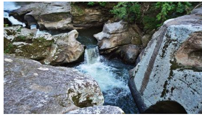
Imagen 5. Cañón de Olama.

El municipio de Muy Muy tiene la dicha de contar con estos dos hermosos lugares que le sirven como centros turísticos de la municipalidad, son bastantes recreativos y atractivo para los niños, jóvenes y adultos tanto de los lugareños como de las personas que visitan de diferentes partes del departamento y del país. (INTUR, 2017)