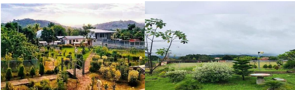
Imagen. 6. Parque municipal.

Es un centro recreativo con un ambiente natural, donde puedes disfrutar con tus amigos y familiares, y realizar tareas, tomar fotos, ambiente cómodo.