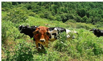
Imagen. 10. Ganadería.

de producción del municipio, ocupando un 74% del territorio municipal. El sector pecuario es el que más ingresos y empleo genera a la economía del municipio. 64% de las explotaciones agropecuarias del municipio poseen ganado bovino. (Alcaldía, Muy Muy, 2011)