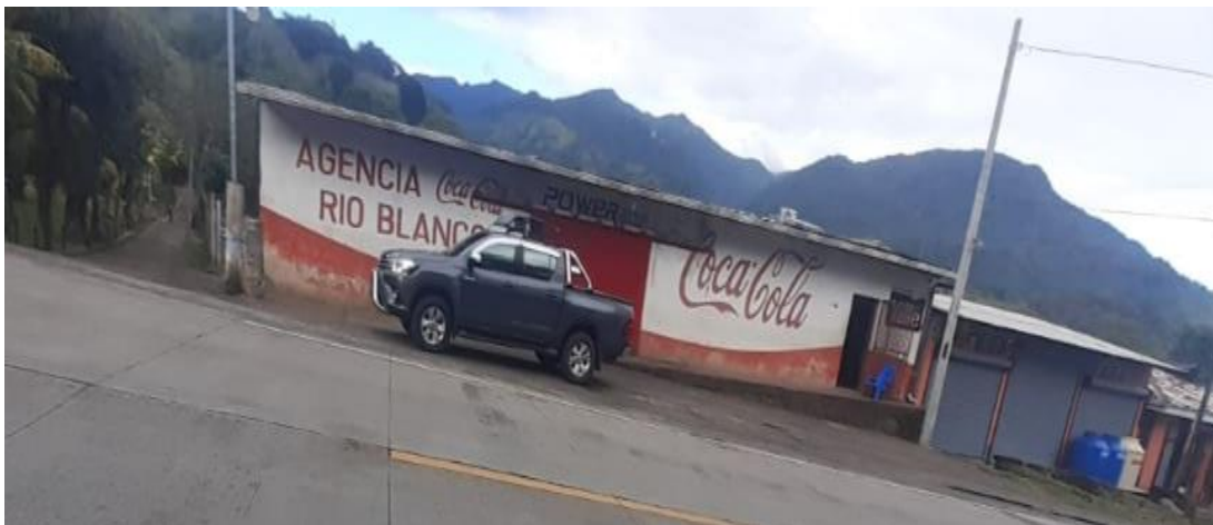
Figura 3: Agencia Coca Cola Rio Banco.

La Agencia Coca Cola Rio Blanco, es una entidad con personería natural ya que está representada por cuenta de un propietario, el cual junto todo capital y el 19 de agosto del año 1999, el decidió emprender su propio negocio comprando de la concesión para su nuevo emprendimiento comercial.