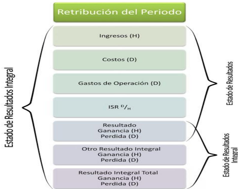
Figura 1: Estado de resultado integral en la Agencia Coca Cola.