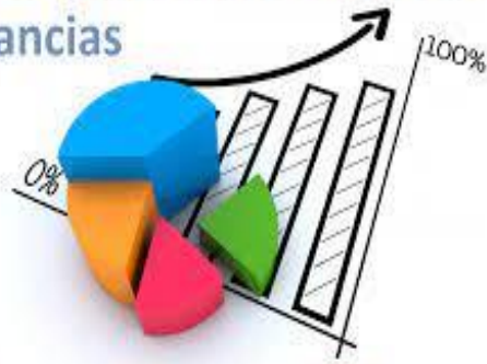
Figura 2: Impuesto sobre las ganancias en la Agencia Coca cola.

La Agencia Coca Cola Rio Blanco, está en la obligación de cumplir con lo que manda la Ley 822 ley de concertación tributaria en el artículo 2, en donde especifica que toda entidad con fundamentos y Principios generales de tributación, estarán en la obligación de reportar todas sus ganancias, todo movimiento dentro de ella, por lo tanto toda empresa comercial debe pagar una renta en donde se denomine la legalidad para favorecer la progresividad, por lo que es necesario incorporar nuevas normas a la organización para continuar el fortalecimiento de la estabilidad.