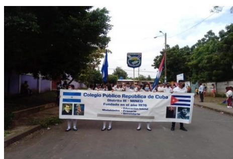
Fuente. Imagen en celebración del aniversario del centro, foto. Tomada y facilitada por la dirección del centro escolar. Año 2020.