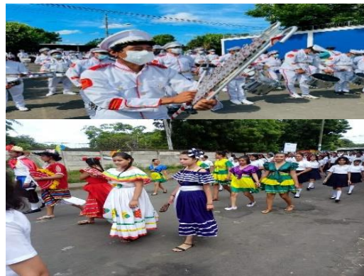
Fuente. Imagen de actividades culturales realizadas en el centro, foto. Tomada y facilitada por la dirección del centro de escolar. Año 2020.

Entre las actividades culturales que celebran están las fiestas patrias como la batalla de San Jacinto y el Bicentenario de la independencia de Centro América, donde el centro educativo participa en los desfiles escolares, realizado por la comunidad educativa del distrito III.