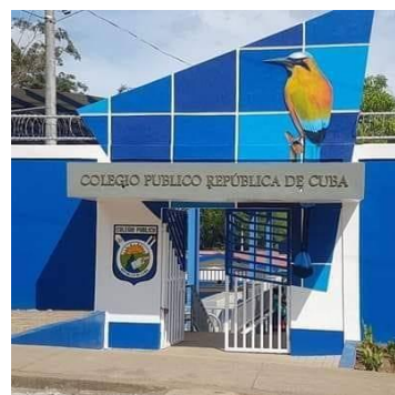
Fuente. Imagen de la puerta de entrada del centro educativo, foto. Tomada y facilitada por la dirección del centro escolar. Año 2020.

Dentro de sus coordenadas, el centro escolar limita al Sur con la calle 8, cerca de la pulpería reconocida como Doña Luz y al norte con la calle N°7 de Sierra Maestra, al Oeste con el poso de ENACAL y al este con la Iglesia Católica Nuestra Señora de Guadalupe, el centro escolar es bastante accesible ya que transitan vehículos por la zona.