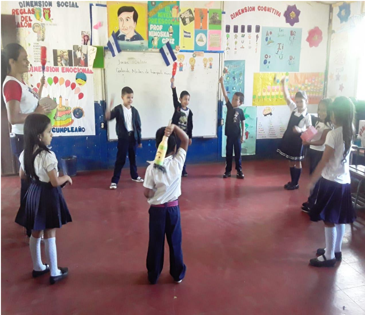
Utilizando instrumentos musicales en música de animación.