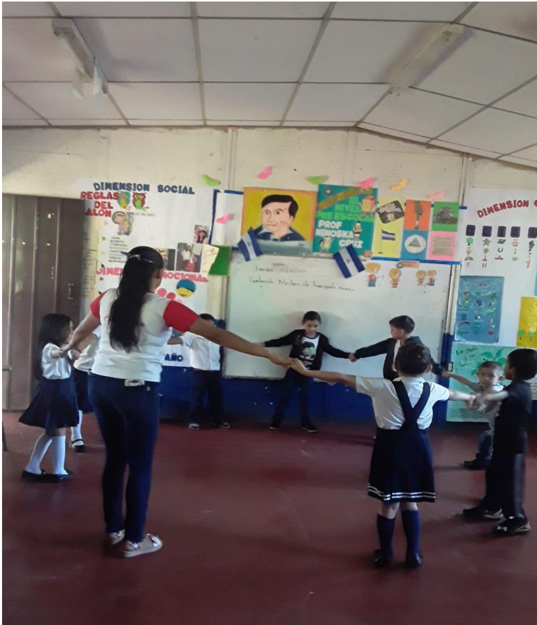
La docente con niñas y niños en la realización de gimnasias matutinas.