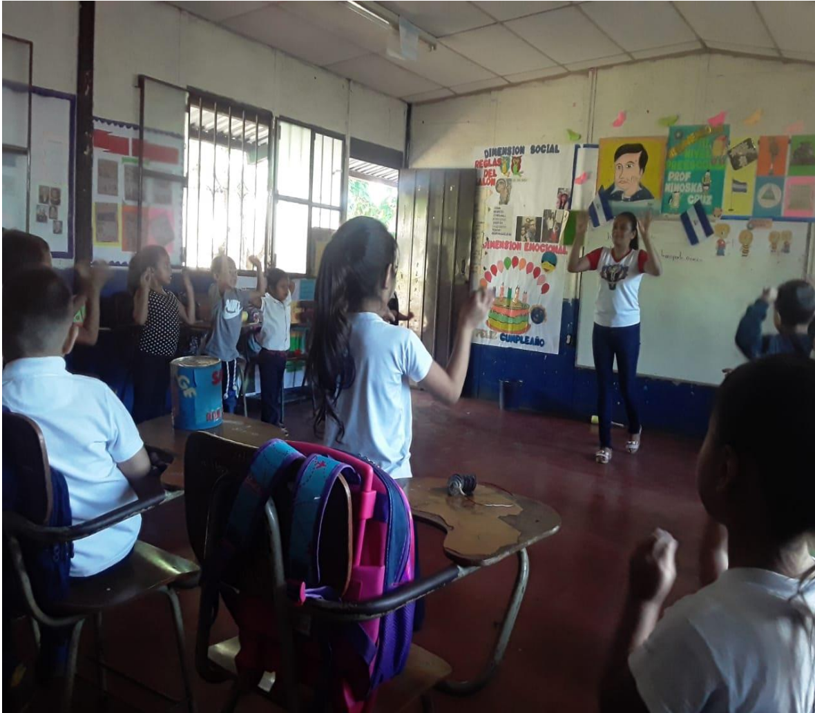
Los dicentes realizando mímicas que hace la docente al sonido de la música.