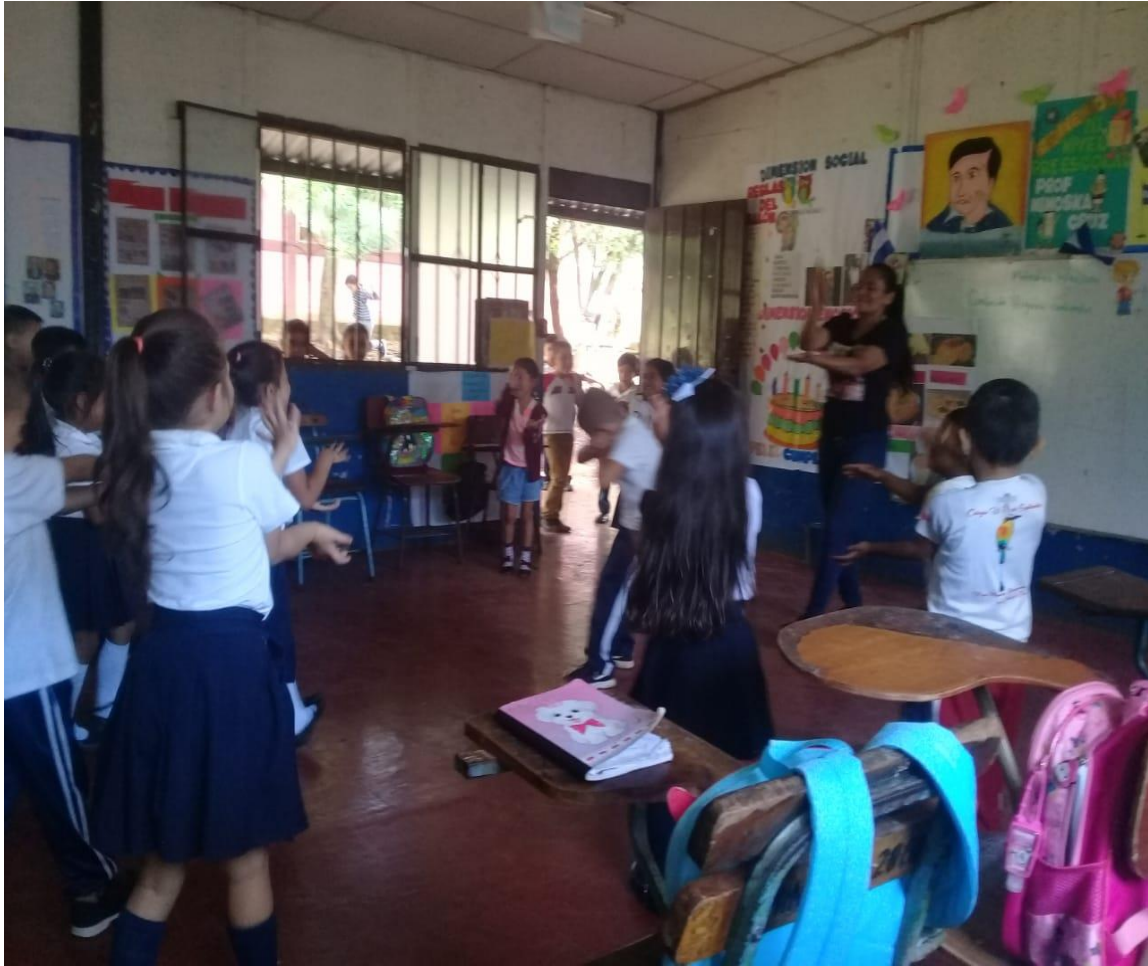
Música con movimientos corporales.