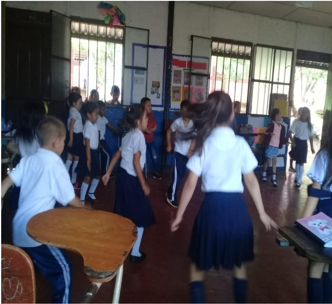
Realizando música con desplazamiento.