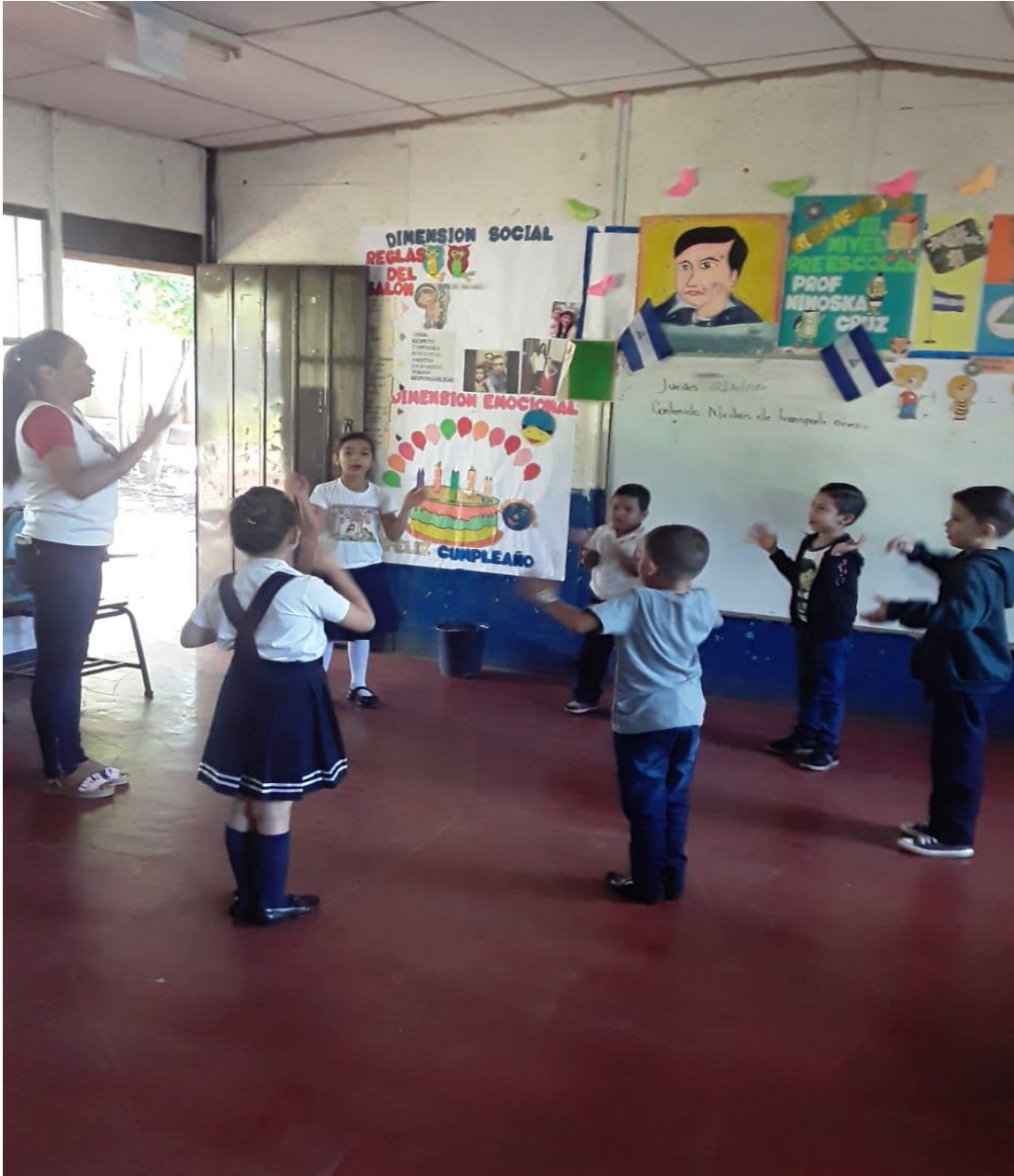
Realizando música de relajación.