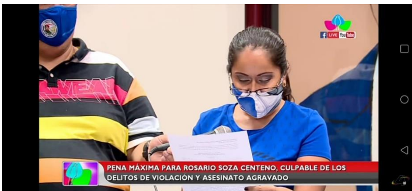
Imagen N° 7:

Título de la noticia: Nicaragua: Violador y asesino de dos niñas en Mulukukú es condenado a pena máxima