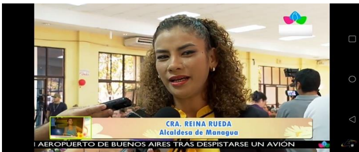
Imagen N° 3 : Fuente: Captura de pantalla Canal 4.

Título de la noticia: Nicaragua avanza con política de equidad de género promovida por el FSLN