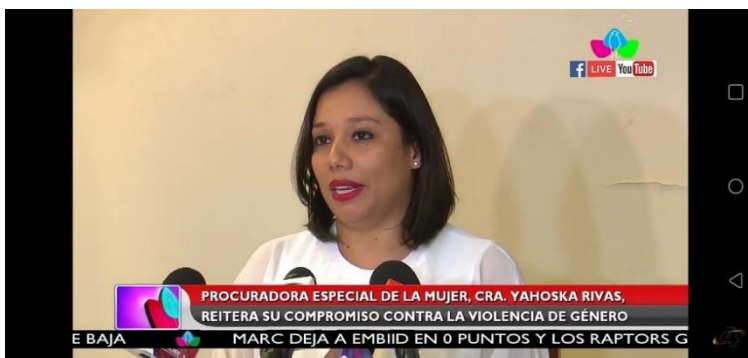
Imagen N° 4:

Título de la noticia: Procuradora especial de la mujer reitera su compromiso sobre la violencia de género