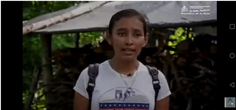
Imagen N° 6: