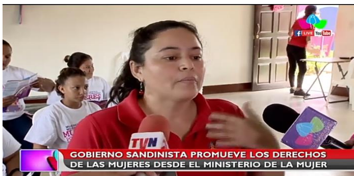
Imagen N° 9:

Título de la noticia: Gobierno Sandinista promueve los derechos de las mujeres desde el Ministerio de la Mujer