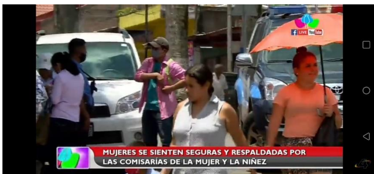
Imagen N° 10:

Título de la noticia: Relanzamiento de la comisarías de la mujer por la campaña “Mujeres Por la Vida, Mujeres Paz y Bien”