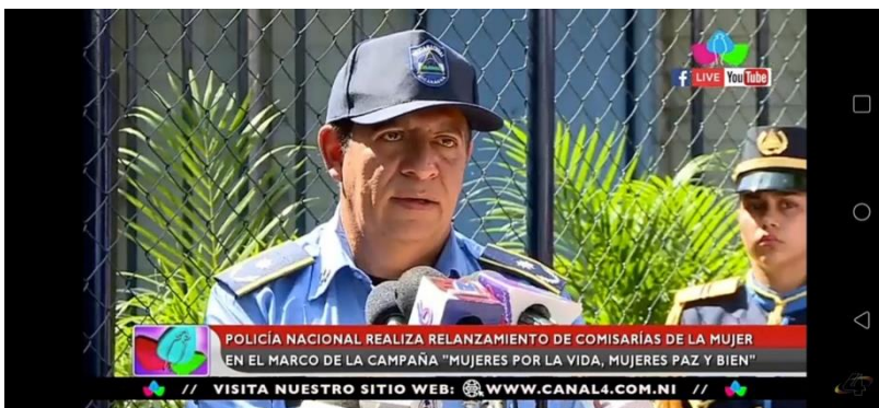
Imagen N 5:

Título de la noticia: Relanzamiento de la comisarías de la mujer por la campaña “Mujeres Por la Vida, Mujeres Paz y Bien”