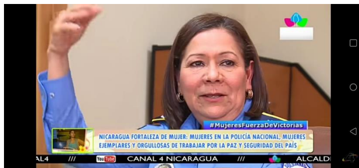
Imagen N° 2:

Título de la noticia: Mujeres en la policía nacional, ejemplares orgullosos de trabajar por la paz en Nicaragua.