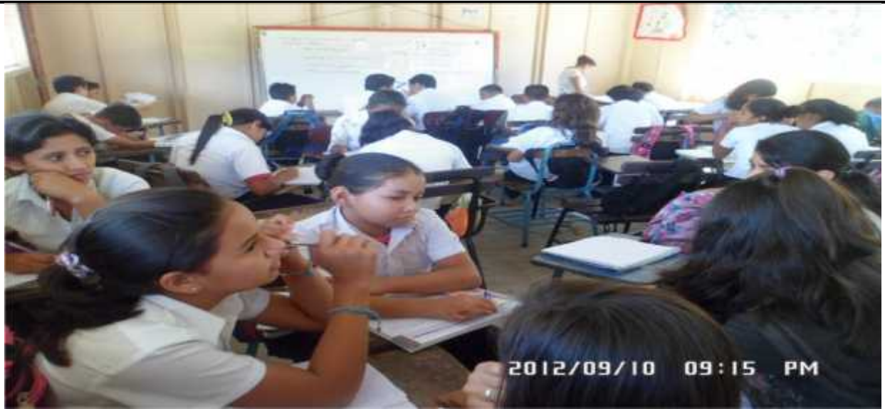
Escenario de Sexto Grado Sección

Análisis de la Formación Inicial recibida por las docentes y su incidencia en los aprendizajes de las y los estudiantes de sexto grado A y B, en la Disciplina de Lengua y Literatura, en el centro escolar Rubén Darío del Municipio de Jinotega, durante el Primer semestre del año 2012.