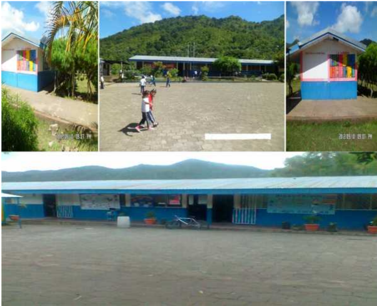
Edificio del Centro Escolar Rubén Darío

Por tanto, para entender la realización del proceso de investigación sobre, Análisis de la formación inicial recibida por los docentes y su incidencia en los aprendizajes de los y las estudiantes de sexto grado A y B, en la disciplina de Lengua y Literatura , se hace necesario describir los espacios donde se produjo el objeto de estudio y que sirvieron de escenario en la realización de la investigación.