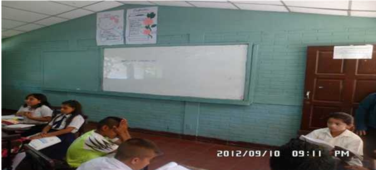
Sexto Grado Sesión A