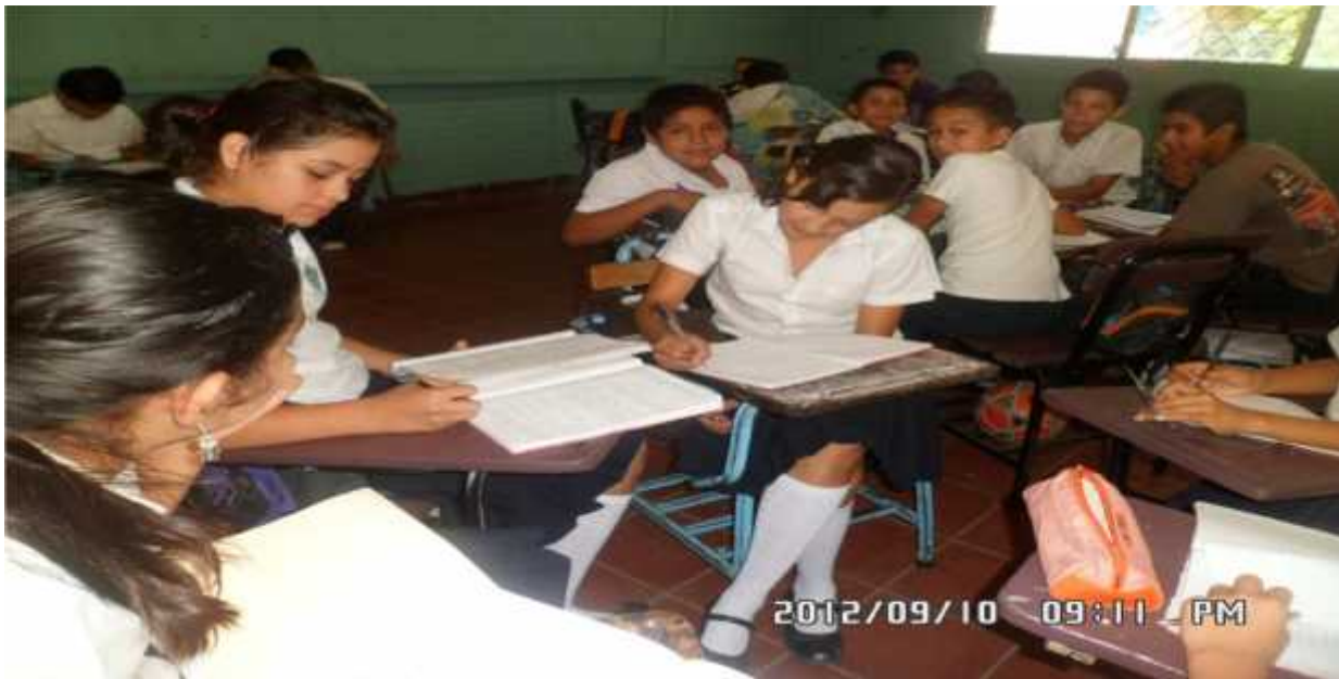
Escenario de Sexto Grado Sección

Las aulas de clase de sexto grado A y B se localizan en el pabellón número uno. Cada aula mide seis metros de ancho por 8 metros de fondo (48 ms 2 ).