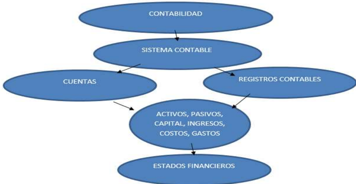
Ilustración 3 Esquema contabilidad