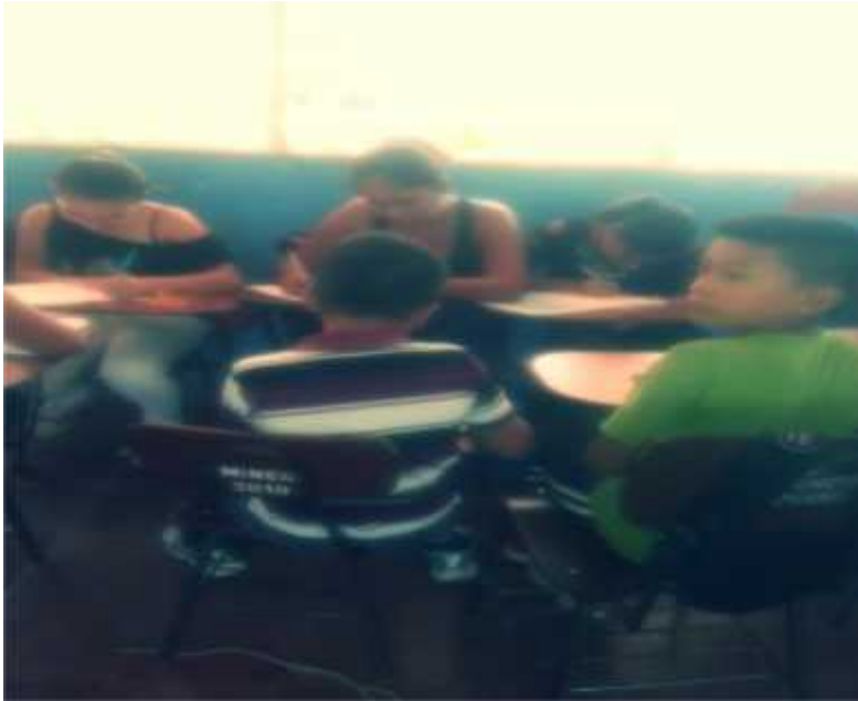
(Niños de quinto grado en la aplicación del pos-test)