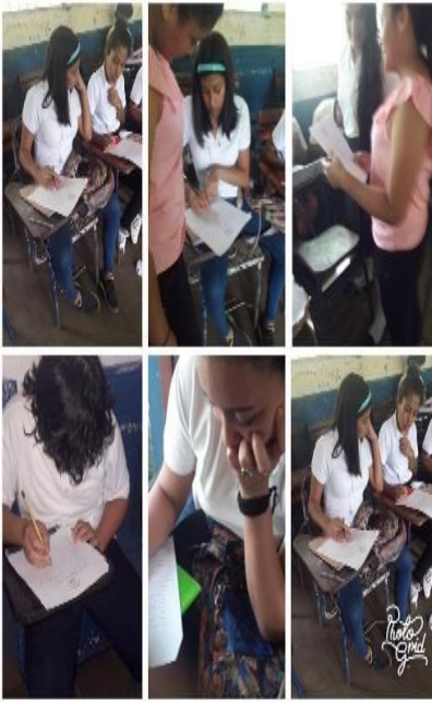
Sesión no 1