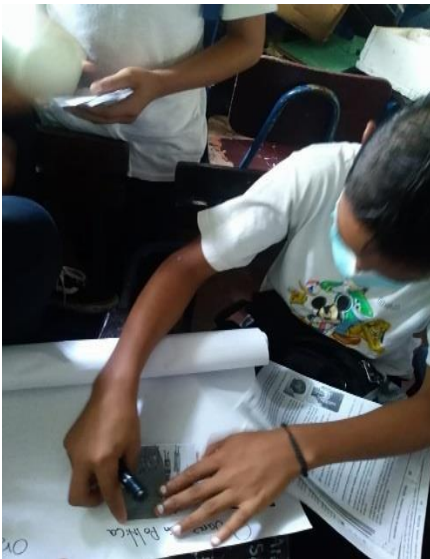
Sesión no 4