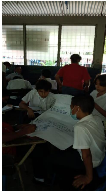
Sesión no 2