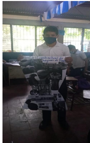
Sesión no 5