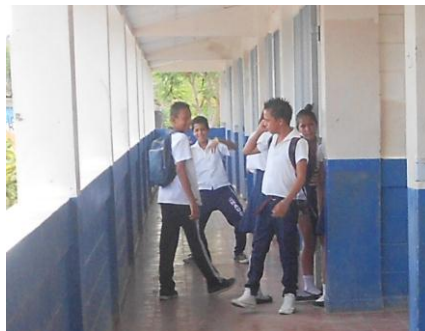
Foto N° 3 Agresiones en horas Clases Foto N° 4 Pierden el Interés y se salen de clases

Por otro lado, los estudiantes no muestran interés por las clases, debido a la poca motivación que reciben por el tipo de estrategias aplicadas, las cuales son muy tradicionalistas, dictan mucho, no toman en cuenta las particularidades de las y los estudiantes, lo que provoca que pierdan el interés, se salen de los salones, se agreden en horas de clases y no realizan trabajos asignados. La interacción social del estudiante con compañeros y maestros son importantes en el desarrollo cognitivo y social, todas aquellas expresiones, opiniones y conceptos que reciben de ellos condicionan positiva o negativamente su vida personal, repercutiendo en la motivación y el rendimiento académico, que pueda alcanzar la persona durante su proceso formativo.