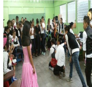
Foto N°1 y 2 Talleres con Padres/Madres y Estudiantes Foto N° 3 Actividades Extracurriculares

En los talleres participaron estudiantes y padres de familia, los cuales destacan que les sirvió de mucho para comprender las causas de los problemas que enfrentan; así como las consecuencias. Los talleres se desarrollaron en un ambiente de animación y confianza lo cual facilitó la participación activa de las y los estudiantes. Estos en su aporte destacan que las charlas le han ayudado a reconocer las afectaciones en su rendimiento y que están de acuerdo en participar en las actividades que les permita elevar su rendimiento.