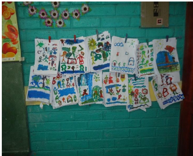
Exposición de los trabajos de los niños