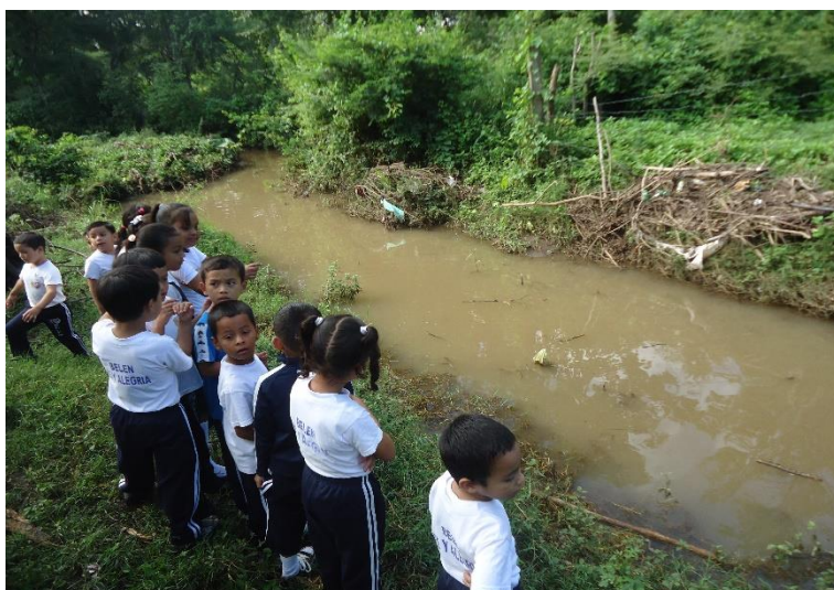
Visita a la quebrada El Zapote