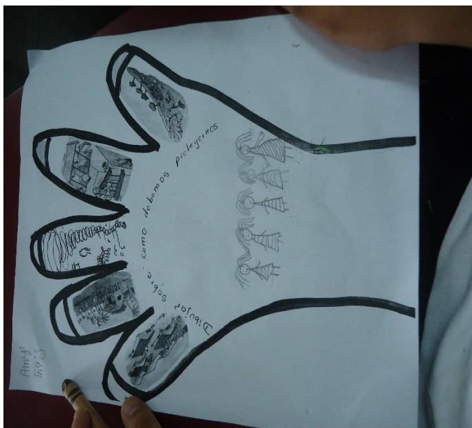
Trabajando con la manito