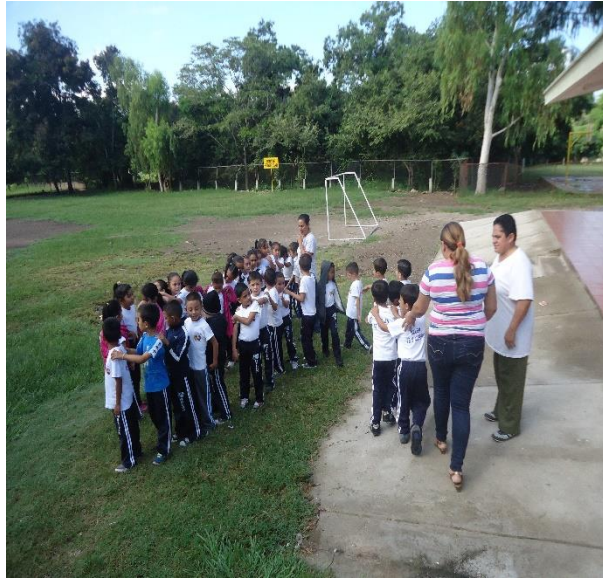
Niños participando en la práctica de la ruta de evacuación con el acompañamiento de las madres