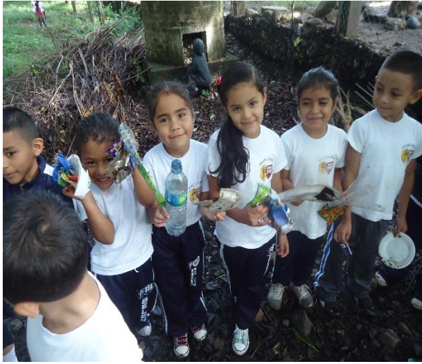
Niños y niñas recolectando basura