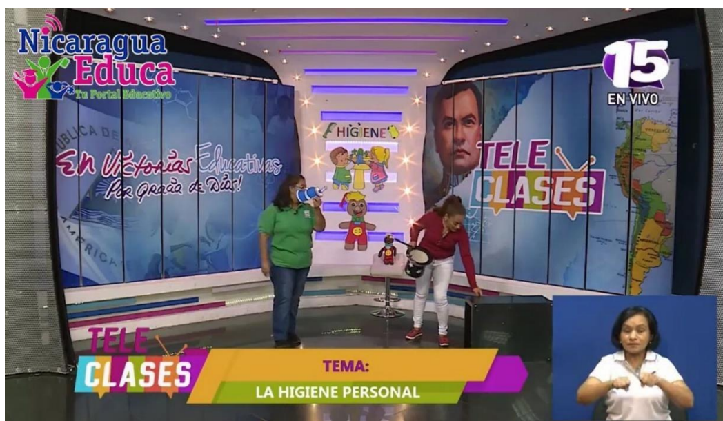
Foto.5 Teleclases, transmitido 03 julio 2020 en Canal 6

De igual manera, se hace uso del lenguaje por señas con el interés que la Teleclase sea inclusiva, puesto que puede existir infantes o acompañantes con alguna discapacidad auditiva, entonces de esta manera el mensaje es transmitido correctamente también hacia ellos. En la siguiente imagen se puede observar en la parte inferior derecha, la imagen de la persona encargada de traducir la comunicación a lengua de señas.