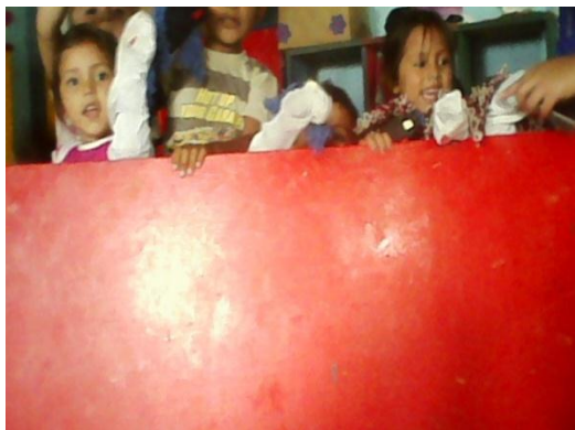
Presentación de títeres, haciendo uso de teatrín