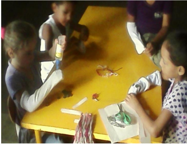
Confeccion de títeres