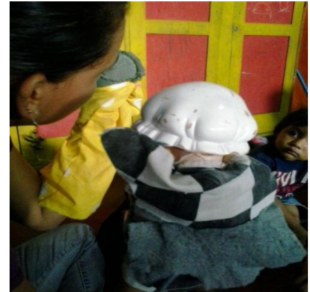
Uso de títeres