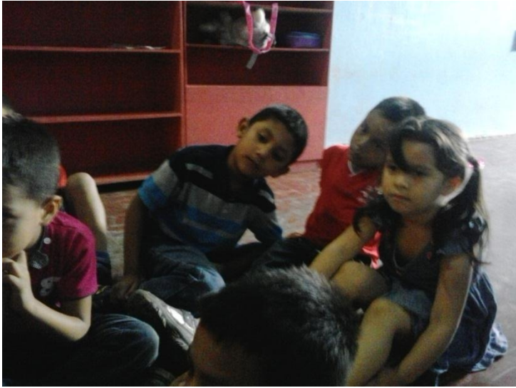
Narración del cuento "El burro"