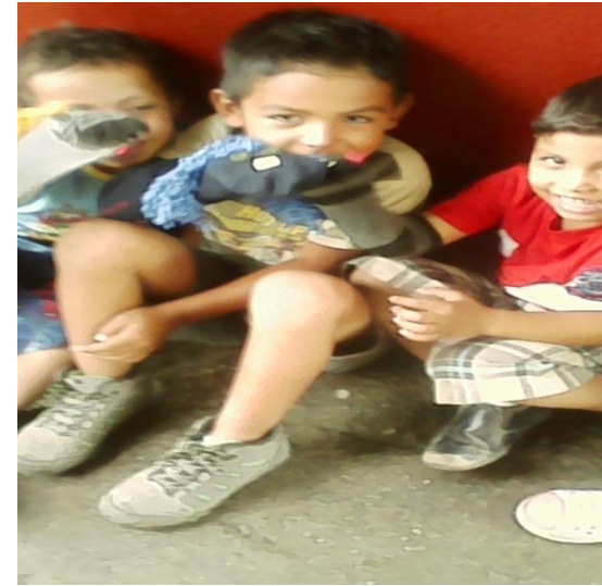
Ensayo para presentación de títeres