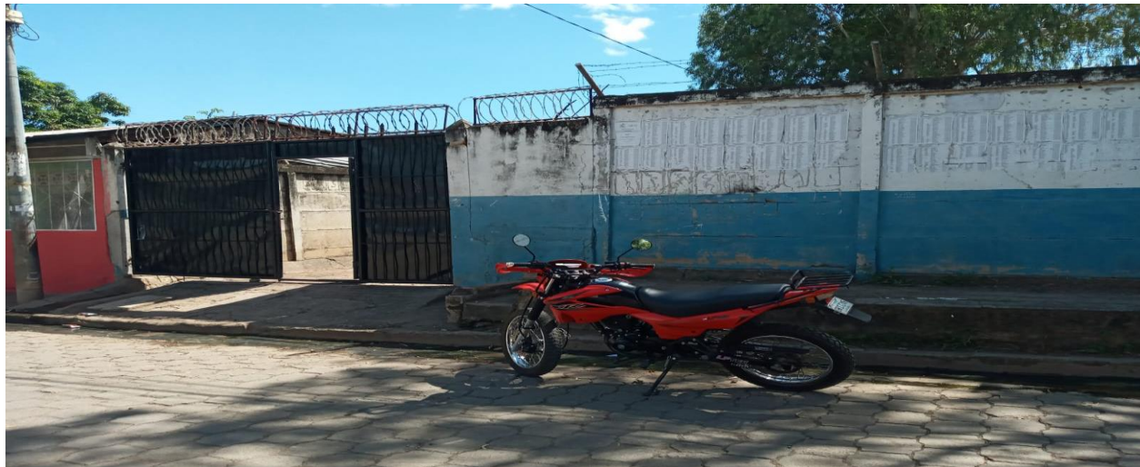
Costado norte de la escuela El Escudo