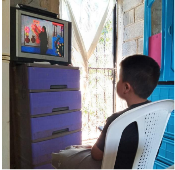
Niño viendo la teleclase