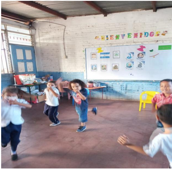
Niños realizando actividad lúdica, saltos