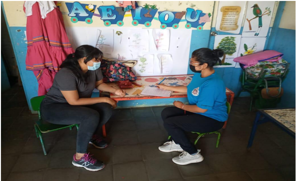
Entrevista a docente