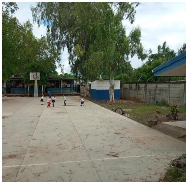
Cancha de la escuela, usada para los matutinos y actividades escolares.