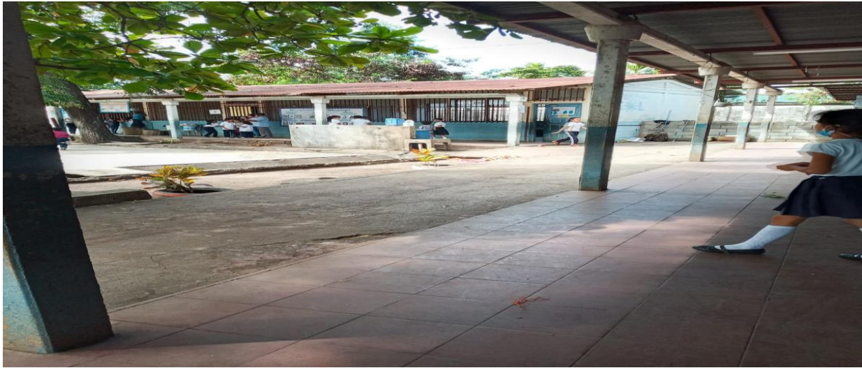
Frente del aula de tercer nivel