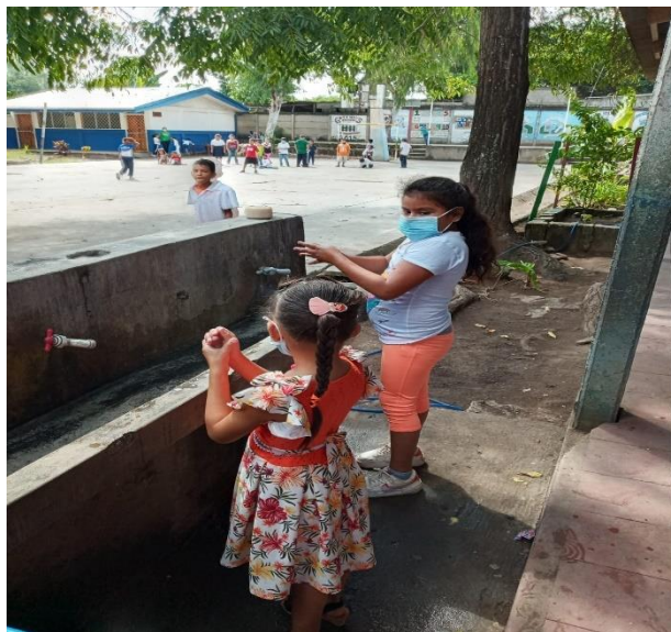
Toma de medidas sanitarias: niñas lavándose las manos