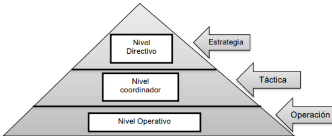
Imagen 1. (Asturia corporación universitaria, pág. 6)