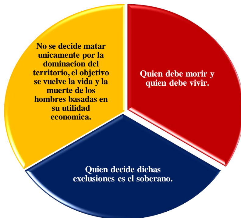
Figura 1: En la siguiente figura se puede ver reflejado, una caracterización general respecto a la Necropolítica realizada por Helena Chávez Mcgregor, para una comprensión más efectiva sobre su funcionamiento.