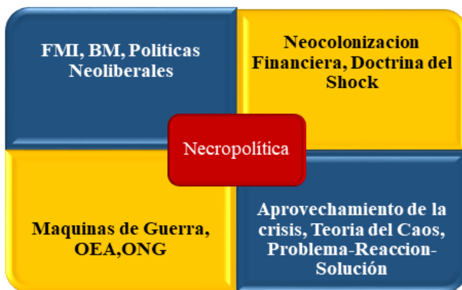
Figura 4: En la siguiente figura, se da a constatar de manera gráfica, los instrumentos y necro acciones de la Necropolítica en América Latina, y como estos, van de la mano con cada uno, obteniendo un fin deseado, en el proceso neo colonizador en el continente, conforme a los intereses del Establishment