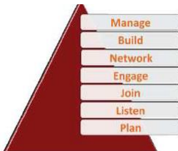
Figura: 2.2. (Merodio, SF, pág. 20)