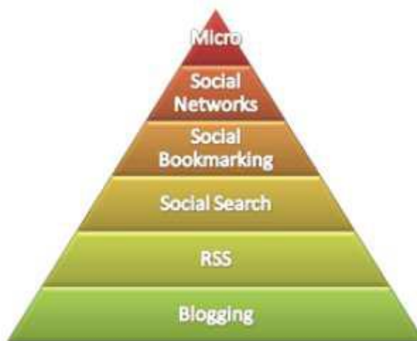
Figura 2.1. (Merodio, SF, pág. 5)