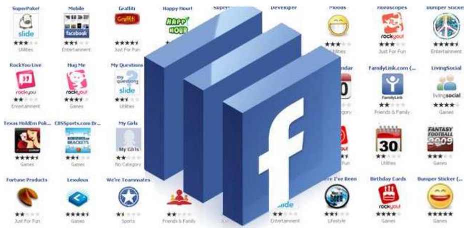
Figura 2.3. (Merodio, SF, pág. 28)

Dentro de las aplicaciones más usadas para las empresas está FBML. Esta aplicación te permite crear una nueva pestaña con el nombre que quieras e integrar en ellas código HTML, o dicho de otro modo, puede incluir información externa a Facebook dentro de tu página como por ejemplo una tienda online o la publicación de una oferta.