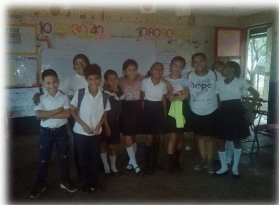
Ilustración 2 Estudiantes de 5to grado