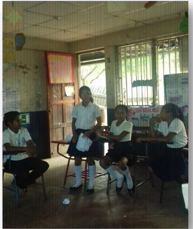
Ilustración 6 Integración de estudiante a la actividad