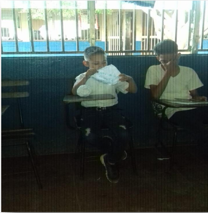
Ilustración 5 Participación a la dinámica