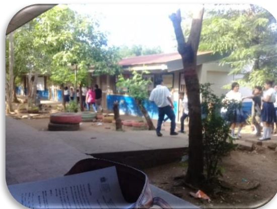
Ilustración 1 Pabellones del centro