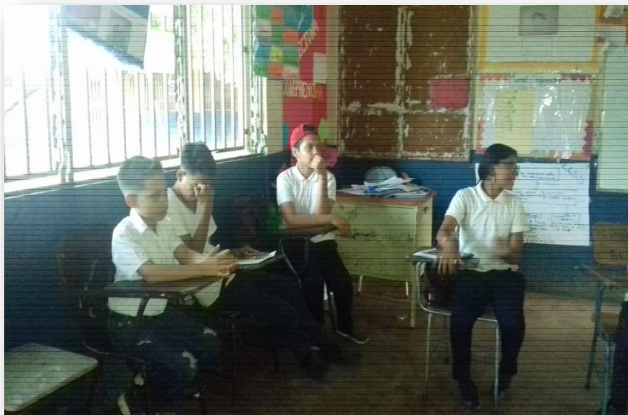
Ilustración 7 Integración de estudiante a la dinámica