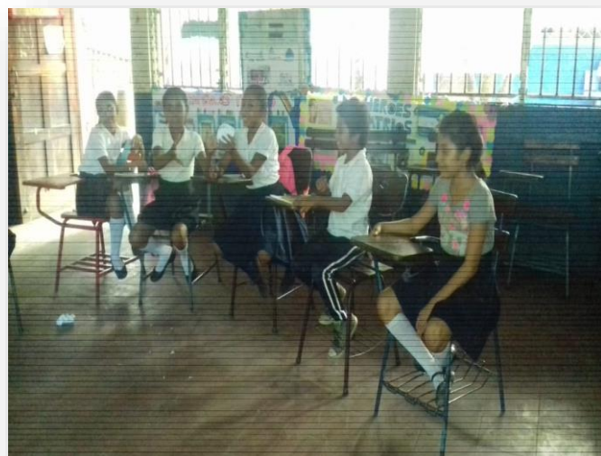
Ilustración 4 Participación de la actividad de integración