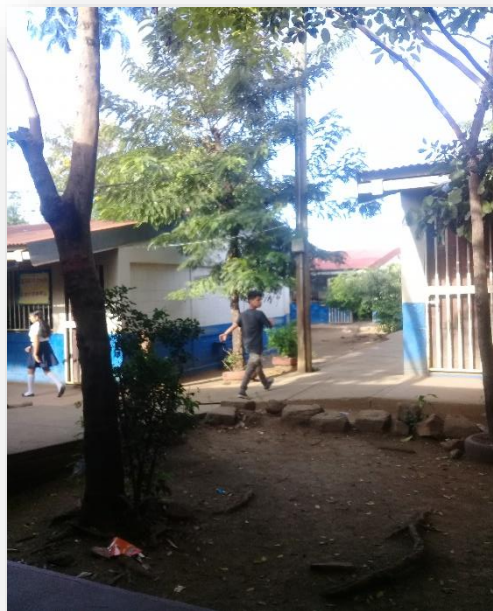
Ilustración 3 Pabellones del centro