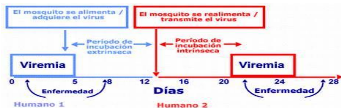
Figura N° 1. Ciclo de transmisión del virus del Dengue