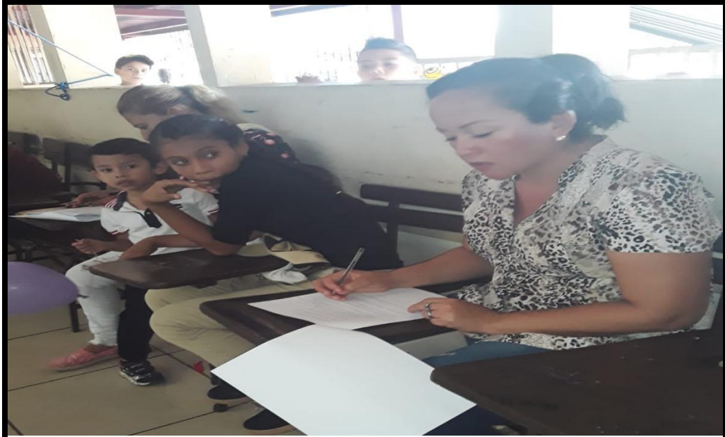
5. Encuesta a Padres