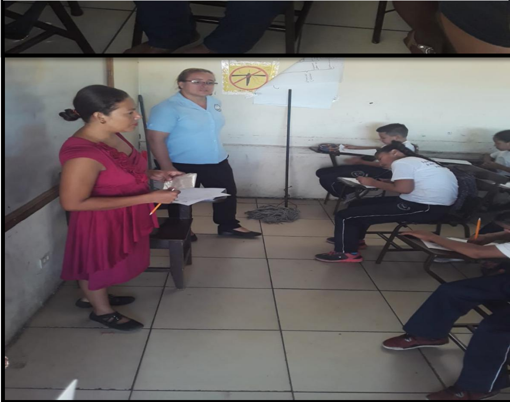
8. Guía de Observación