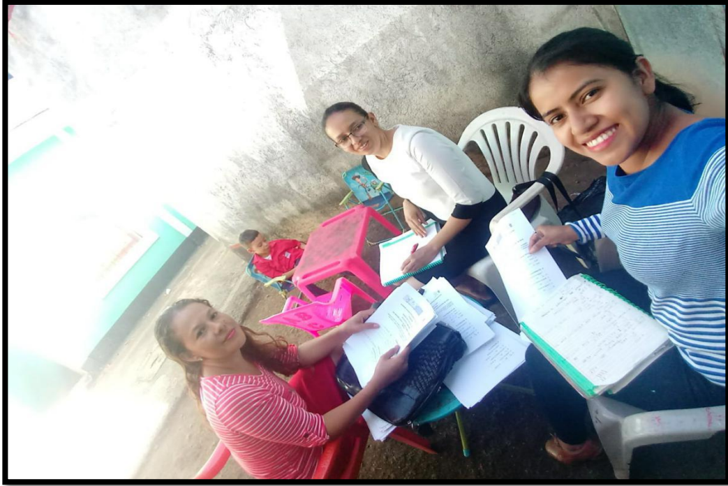
1. Trabajo en Equipo