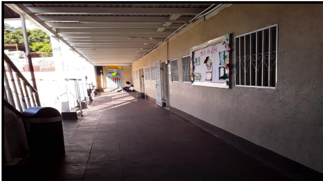
3. Aula de Quinto B