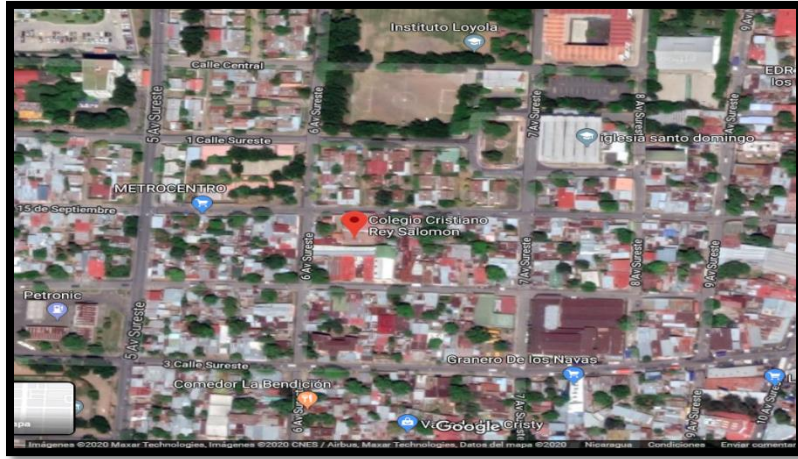
Fig.1 Ubicación Centro Cristiano rey Salomón