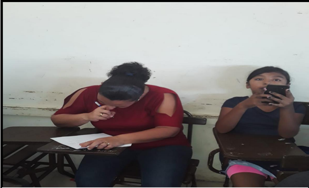
7. Encuesta Padres