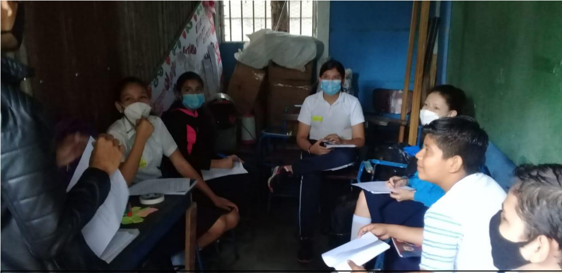
Ejecutando grupo focal con estudiantes de 7º grado del Instituto Nacional Reino de Suecia