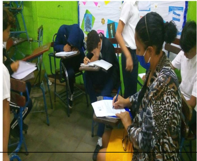
Docentes y padres compartiendo conocimientos mediante las entrevistas cuestionarios abierto.