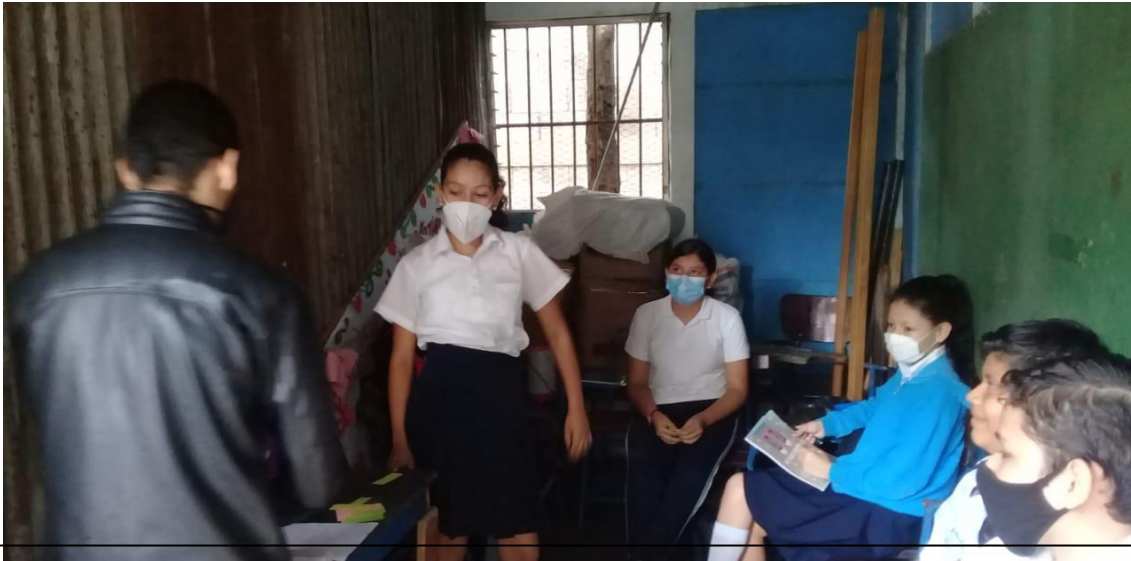
Estudiantes compartiendo conocimientos sobre disciplina consciente