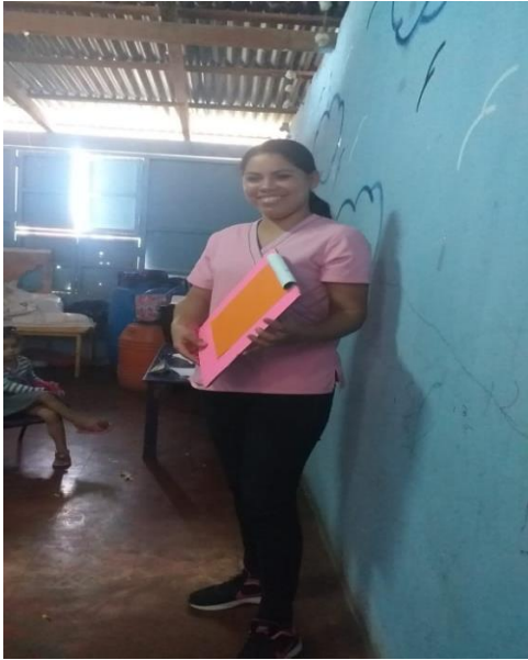
Implementación de estrategia (adivanzas de frutas)