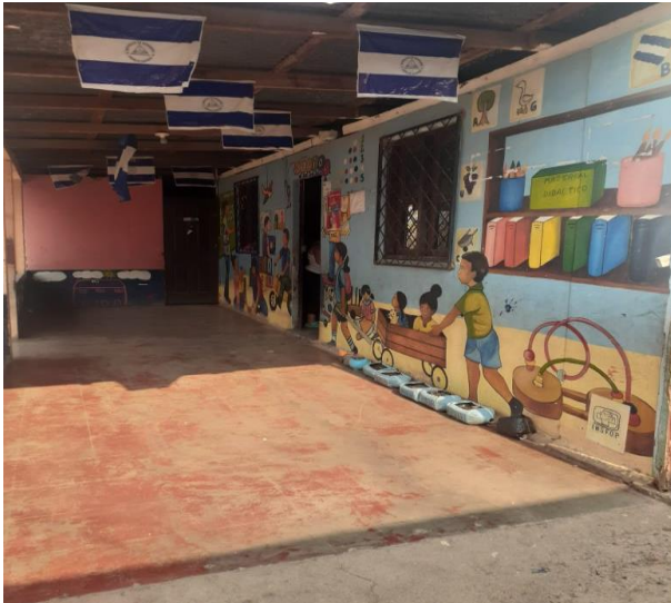
Centro Comunitario Estrellitas del Futuro No. 1