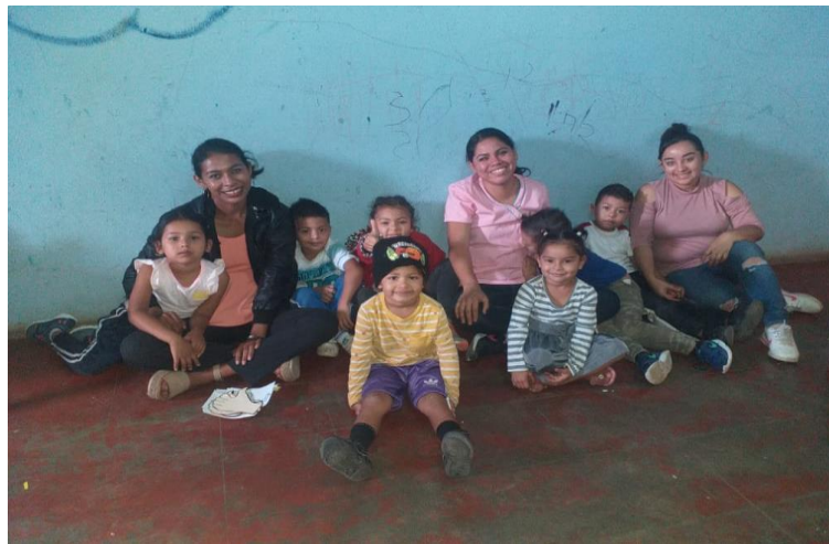
Grupo de investigadoras, con niños de I y II nivel