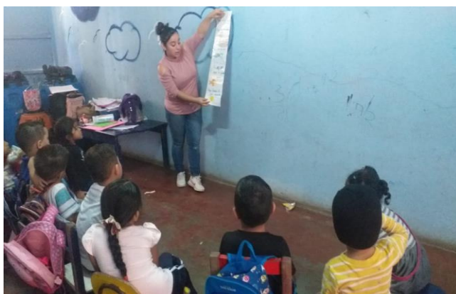
Implementación de estrategias (textos cortos)