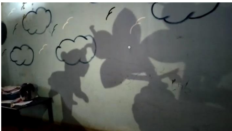
Narración de fábula el oso y las abejas a través de sombras