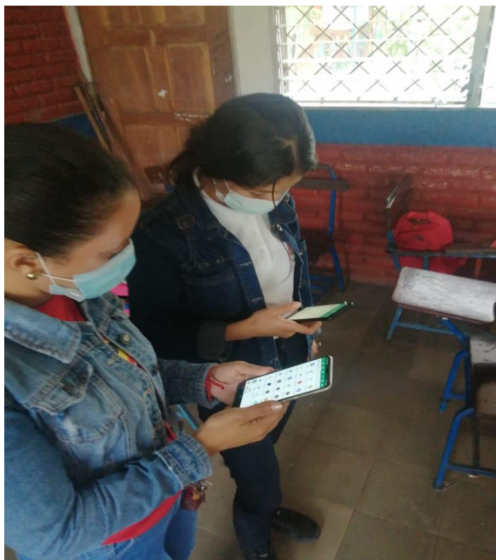
Anexo. 9 transferencia de aplicación Ortograf a estudiantes