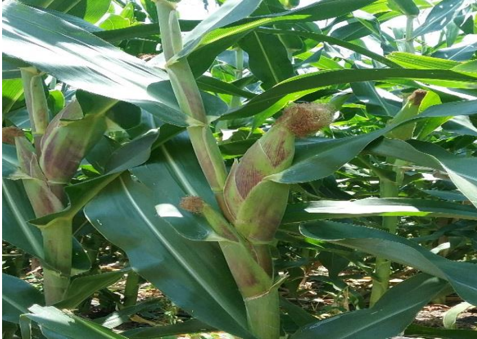
Cultivo de Maíz antes de la cosecha.