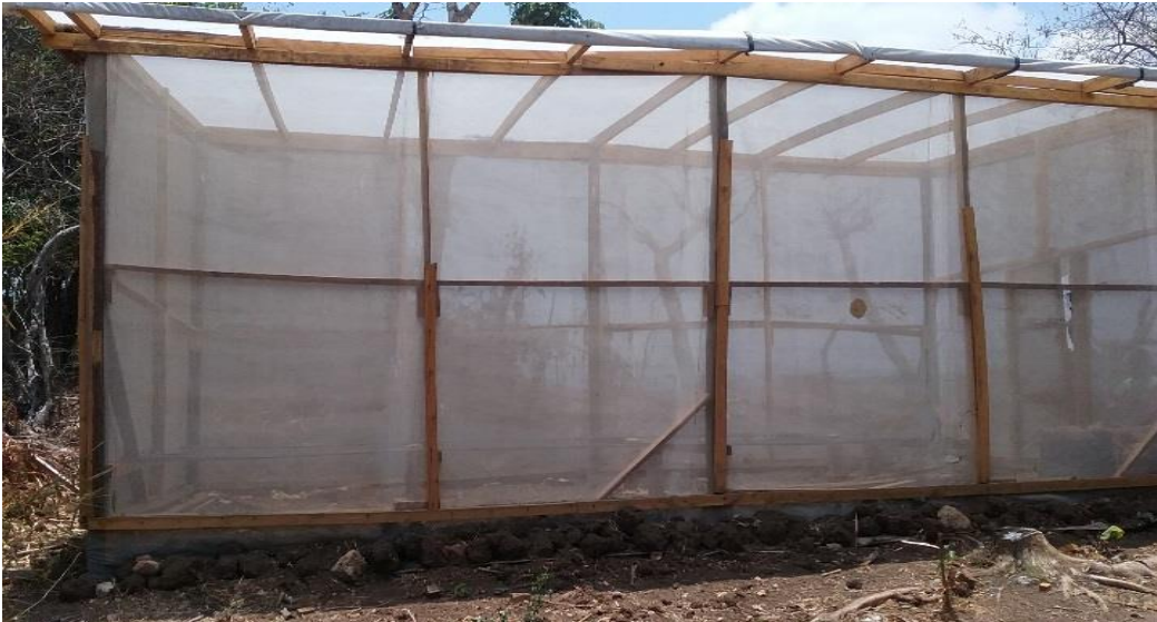
Invernadero donde se lleva el crecimiento de Plántulas de Tomate.