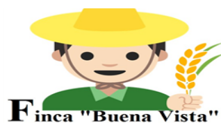
Implementación de Sistema de Costos Agropecuarios

En esta figura se muestra todas las depreciaciones realizadas durante los procesos productivos de Maíz y Tomate las cuales forman parte del activo fijo y de las herramientas mejores.