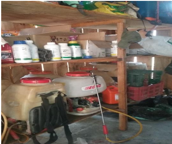
Bodega de Insumos y Fertilizantes