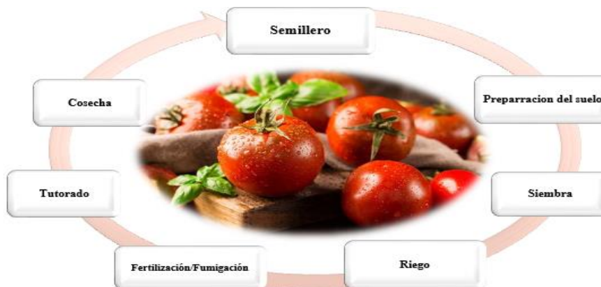
Figura 2: Proceso Productivo del Tomate

Por otro lado se pudo determinar el proceso productivo de Tomate donde se estuvo presente en cada etapa del cultivo y donde se permitió recolectar información para explicar paso a paso cada uno de las fases del cultivo de Tomate: