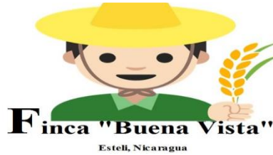
Tabla N°01. Saldos iniciales con los que cuenta la Finca