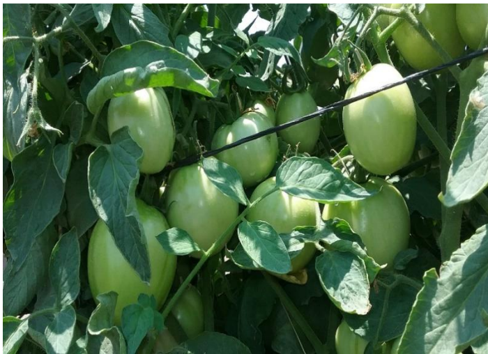
Cultivo de Tomate antes de la Cosecha