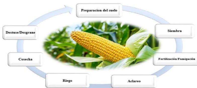
Figura 1: Proceso Productivo del Maíz

Según entrevista realizada a colaboradores de la finca y a uno de los socios, expresaron que utilizan métodos tradicionales y sencillos al momento de iniciar cada etapa de la producción según la experiencia que poseen con ciclos de producción realizados en ocasiones anteriores tal y como se detalla a continuación: