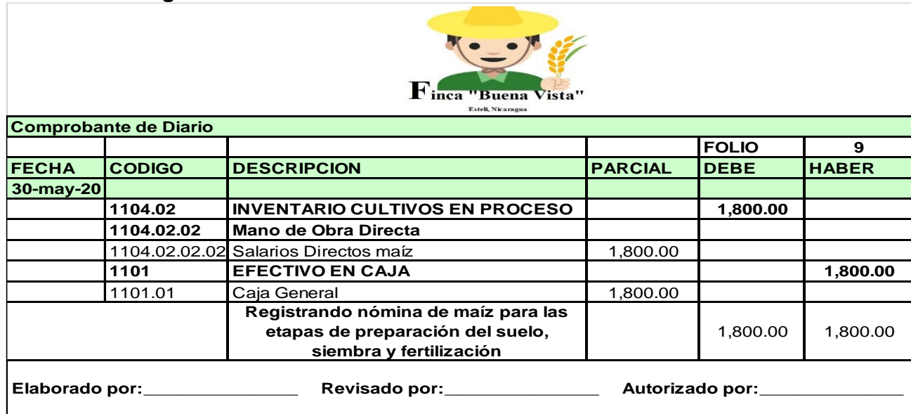
Tabla N°09. Pago de nómina maíz.