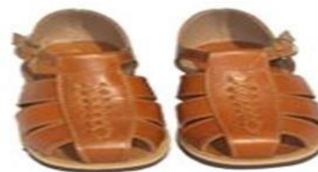
Mascara de Perro