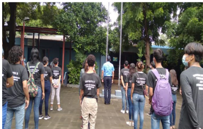
Imagen 2.

Los beneficiarios del programa coinciden que su principal aprendizaje es el respeto a la familia y a las autoridades, la adquisición de habilidades técnicas que les facilitó la auto superación, mejorar en su autoestima.