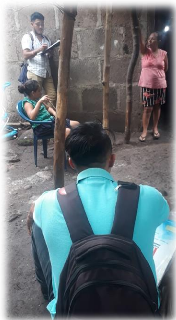
Entrevista a madre de familia de la comunidad Acedades.