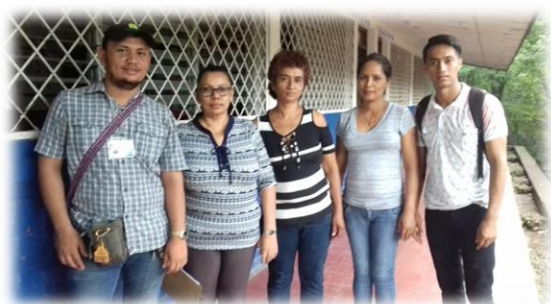
Investigadores y maestras del colegio “Cruz María Montiel Ortega”