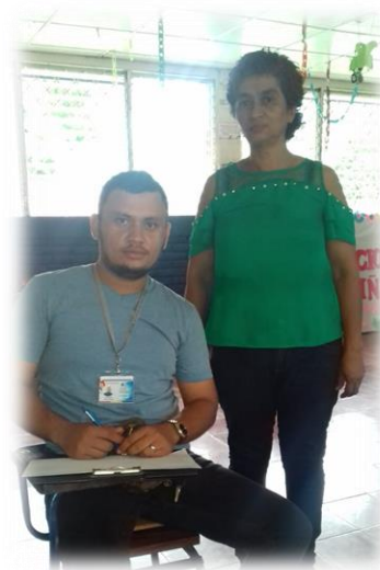
Investigador y Líder Política de la comunidad Acedades.