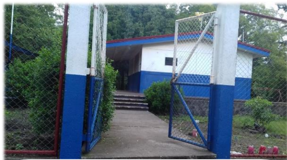
Fuente: Propia, Colegio “Cruz María Montiel Ortega” Fecha: 13/11/19

En la comunidad existe únicamente un centro escolar publico donde se imparte preescolar, primaria regular y secundaria a distancia, la matrícula actual por la mañana es de 52 estudiantes, de preescolar a cuarto grado, atendidos por 5 docentes y 3 por la tarde que imparten 5to y 6to grado, regido por el Ministerio de Educación (MINED) además tienen el beneficio de la merienda escolar organizando a los padres de familia por día para que se le facilite a cada estudiante su alimentación.