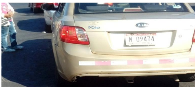
Fotografía N° 6:

Según lo establece el Código de la Niñez y Adolescencia de Nicaragua en su Arto. 62. Créase el Consejo Nacional de Atención y Protección Integral a la Niñez y la Adolescencia, el que estará integrado por organismos gubernamentales y de la sociedad civil. Su organización será regulada por ley de la Asamblea Nacional en el término de sesenta días contados a partir de la entrada en vigencia del presente Código.