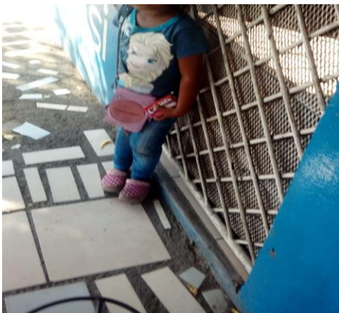
Fotografía Nº 1:

Es común ver por las calles, paradas de autobuses, y mercados a niños vendedores de agua, refrescos y caramelos.