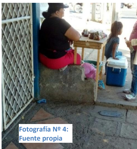
Fotografía N° 4:

En muchos lugares existe la falta de información sobre las consecuencias negativas que conlleva el trabajo infantil para los niños. Es común que en la mayoría de los casos el trabajo infantil va pasando de generación en generación, es decir, de padres a hijos. Si los padres no tienen el conocimiento adecuado y además el padre o la madre ha trabajado desde niños es normal