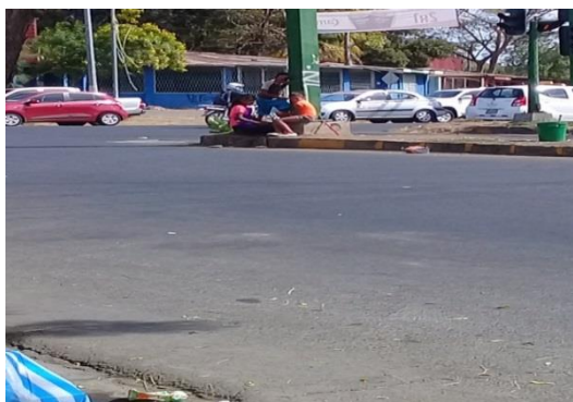
Fotografía N° 3: Fuente propia

Además de los efectos antes mencionados cabe recalcar que el trabajo también interfiere con el derecho a la educación pues debido a los horarios y cargas laborales los niños no asisten a la escuela y en el caso de aquellos que trabajan y estudian, tienen mayores dificultades para aprender, un mayor índice de repetición y abandono escolar, lo cual conduce a una menor percepción de ingresos en el futuro, mayor pobreza, una mayor exclusión social, explotación y abusos pues estos niños sólo podrán acceder a las ocupaciones que exijan menor calificación al igual que su salud se deteriora pues mientras trabajan no reciben la alimentación apropiada.