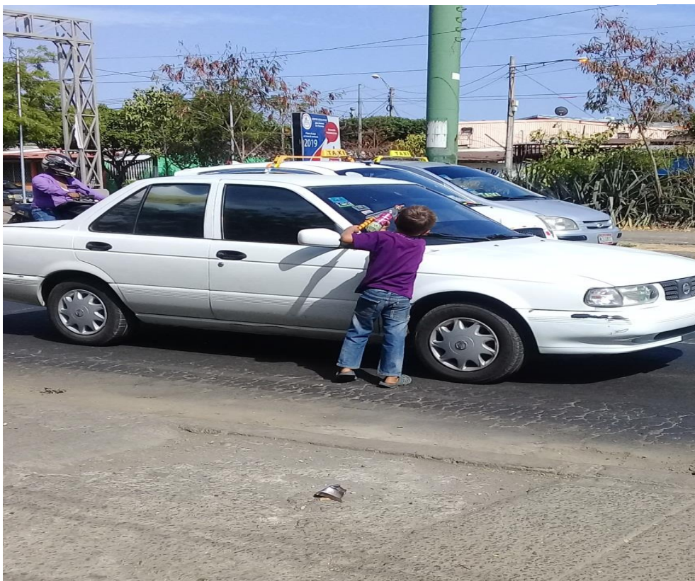
Trabajando largas jornadas hasta la noche