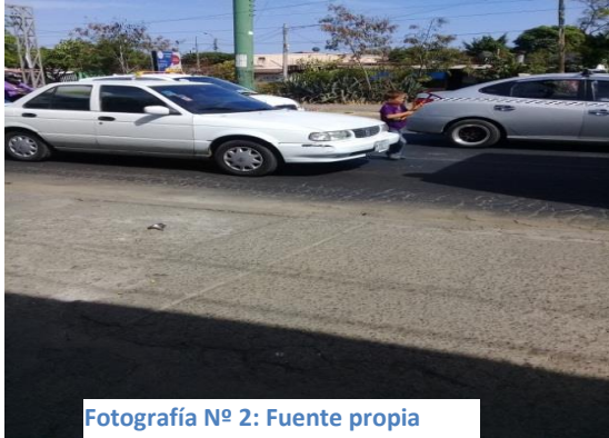
Fotografía Nº 2:

estómago con la ilusión que les vaya bien en el resto del día, pasando largas horas trabajando en el lugar.