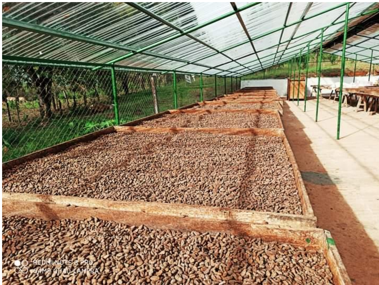
Cacao Orgánico en proceso de secado en el centro de procesamiento ubicado en la comunidad "La pozolera" Waslala.