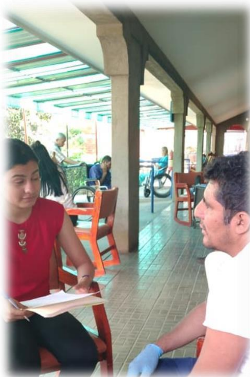
Ilustración 9 y 10 Entrevista a personal de atención del adulto mayor