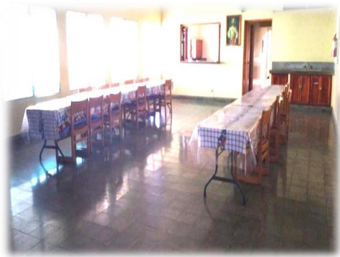
Ilustración 4 Comedor del hogar Tomada 18/03/20 16:55pm por el equipo investigador

Además, cuenta con dos espacios de cocina, una para los adultos mayores que son residentes y otro es ocupada para todas aquellas personas de la tercera edad que son de escasos recursos y son atendidos de manera externa, con alimentos. El hogar también tiene un área de lavandería.