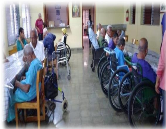
Ilustración9 "Adultos mayores en el hogar a espera de la cena". Tomada 18/03/20 14:15