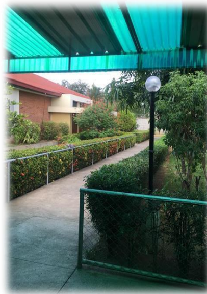
Ilustración7 Áreas verdes Tomada el 20/03/20 por el equipo investigador

Por medio de la observación se apreció que algunos adultos mayores hacen uso de las áreas verdes como las bancas de concreto y los alrededores del hogar.