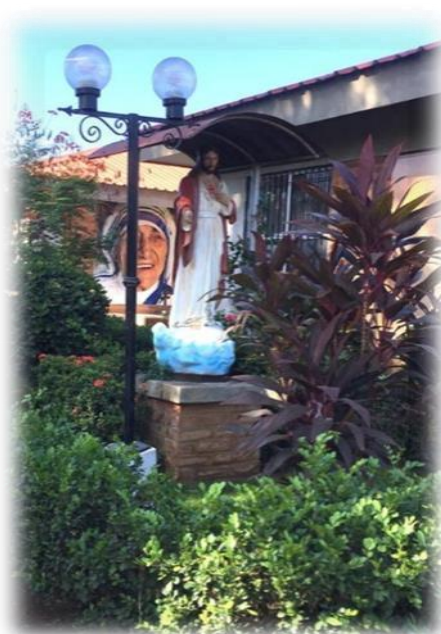
Ilustración 3 Estatua del Sagrado Corazón de Jesús. Tomada 18/03/20 16:54 pm por el equipo Investigador

En la parte trasera de la infraestructura está situado el edificio del Hogar Sagrado Corazón de Jesús, cuenta con paredes que están construidas con ladrillos rojizos de barro, el techo está fabricado con una estructura aligerada con escayola, cuentan con ventiladores de techo y lámparas que permiten una buena luminosidad para el adulto mayor, en sus afueras tiene rampas con piso de concreto para el acceso de personas con discapacidad y pasamanos para proporcionar estabilidad y soporte a los adultos mayores que hacen uso de ello.