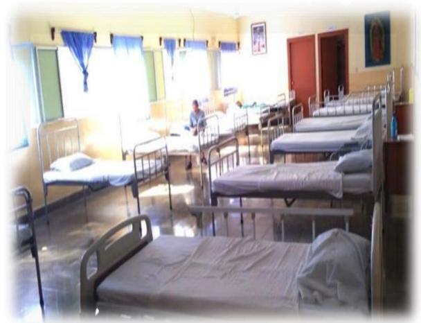
Ilustración 6 Sala de dormitorio B Tomada el 18/03/20 16:59pm Por el equipo investigador

En el hogar existen dos salas donde están las camas para los adultos mayores, están divididos por dos secciones A y B, los cuales cuentan con 14 camas en cada sala, para un total de 28 camas, donde 11 adultos mayores están en la sala A y los otros 11 adultos en la B, quedando 6 camas disponibles actualmente. Tienen también 2 camas emergentes, camas de baños y algunas camas cuentan con barandas a los lados.