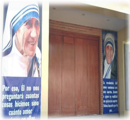
Ilustración6 Entrada a la parroquia del hogar. Tomada 23/03/20 15.32 pm por el equipo Investigador

luminosidad, dentro de cada sala se encuentran los baños e inodoros, lavamanos vestidores.