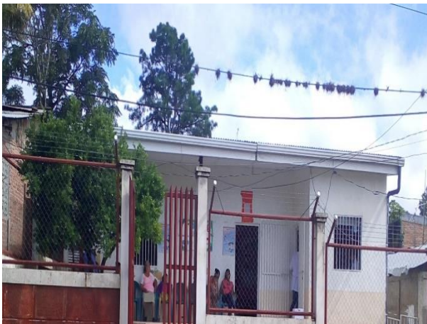
Ilustración 1 Área frontal del P/S.

El Puesto de salud salida Waslala se encuentra ubicado en el Barrio calle central, ha obtenido la placa a la excelencia por 2 años consecutivos desde que inicio a brindar atención sanitaria cumpliendo los indicadores y metas que lo han hecho destacar como el puesto de salud a nivel municipal, en el cual se brinda atención a la mujer, seguimiento del desarrollo a la niñez,