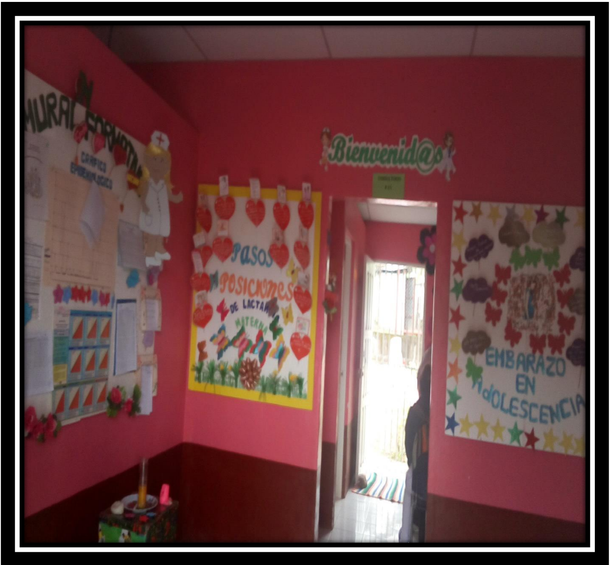
Ilustración 20 Área interna del P/S.