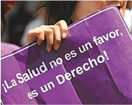
Ilustración 6 https://wikipedia.es

(Luis M, 2017) El derecho a la salud debe ser respetado por las entidades administradoras de recursos así como las que prestan los mismos, la obligación del estado es proporcionar un sistema de protección sanitaria, Como usuarios debemos entender que se violan los Derechos Humanos al violarse el derecho a acceder a servicios de salud de manera oportuna, eficaz y con calidad.