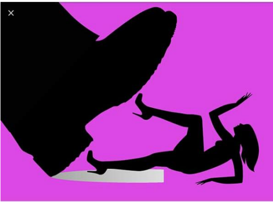
Ilustración 15 http://www.slideshare.net

(Fida, 2019) La desigualdad de género es un fenómeno en el que se produce una discriminación entre persona debido a su género. Las diferentes funciones y comportamientos pueden generar desigualdades de género, es decir, diferencias entre los hombres y las mujeres que, favorecen sistemáticamente a uno de los dos grupos.