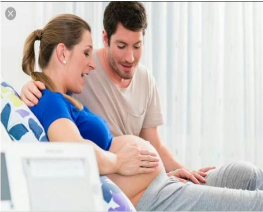
Ilustración 5 https://www.oms.gob

(Hans, 1996) Las funciones que se les adjudican a los hombres y a las mujeres, se aprenden en el lugar de origen en el contexto cultural en que crecimos como el respeto, confianza y comunicación, son valores fundamentales en el núcleo de la familia. La pregunta intenta indagar si las usuarias creen que su pareja está obligada de alguna manera a estar presente en las consultas sanitarias.