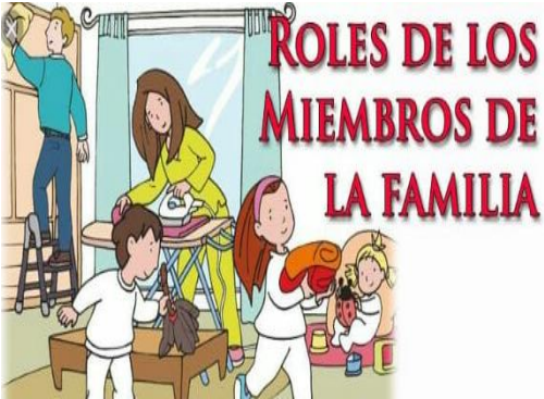
Ilustración 9 https://www.RedDESC.org

(Monteros, 2018) El rol es un papel que un individuo o cosa determinada juega en un determinado contexto. Por ejemplo, una persona puede asumir el rol de padre dentro del ámbito de una familia y a su vez asumir el rol de empleado en una empresa. El rol tiene que ver con la función que se ejerce, con el sentido de las actividades que se desarrollan. Es por lo expuesto es que el