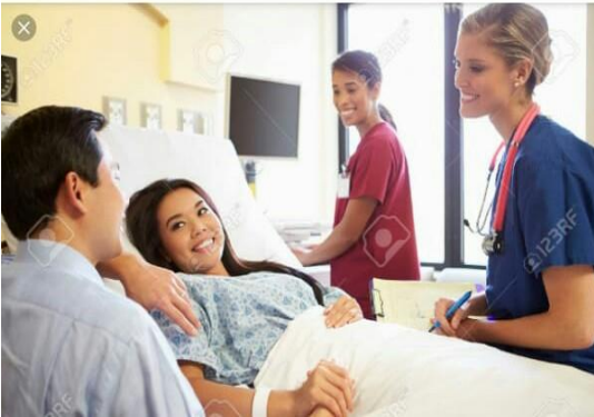
Ilustración 17

(García, 2010) Desde el punto de vista social puede definirse que la presencia del hombre en las consultas sanitarias de la mujer influye en la salud de ella, es por eso que figuradamente la expresión tener presencia puede aludir al interés de la pareja del uno así al otro.