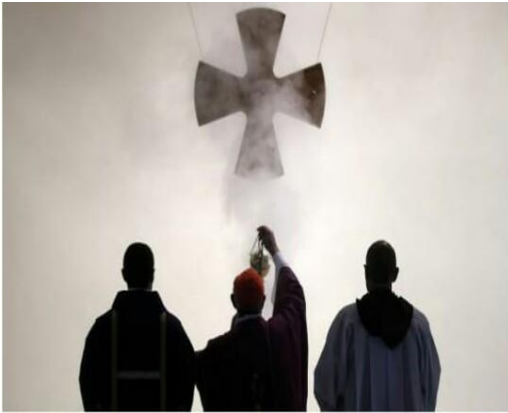
Ilustración 10 Https://: www, tercera informacion.ni

(Castañeda, 2007) La religión cristiana (Católica y evangélica) está basada en la moral que enseña la biblia, cuyo contenido cultural es evidentemente machista, el concepto de Dios es patriarcal y la mujer figura un papel secundario en la religión. (1ra de Timoteo 2:8-15). En el Antiguo Testamento la mujer aparece ya como lo negativo, la representación del pecado, con una Eva que, sin entidad propia y fruto de una