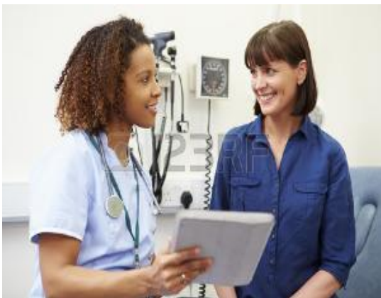
Ilustración 7 http://www.salud.gob.ar

(OPS, 1997) Es un pilar fundamental en todas las estrategias sanitarias que inicien programas de desarrollo y gestión de la calidad, la comunicación para la salud es el proceso social, educativo y político que incrementa y promueve la conciencia pública sobre la salud. El personal de salud debe instar la inclusión de la pareja en la atención prenatal para que esté enterado