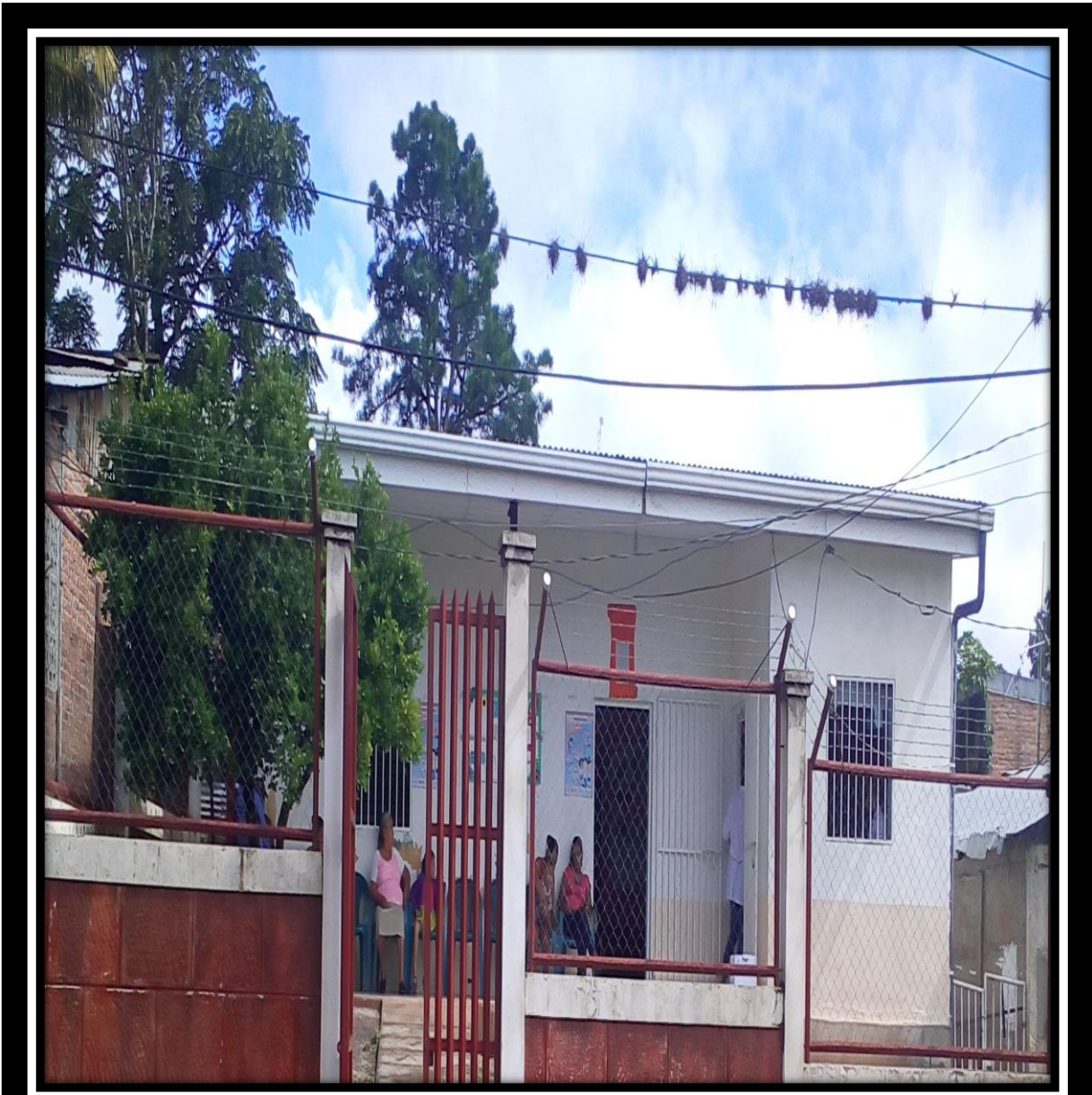
Ilustración 19 Área frontal del P/s