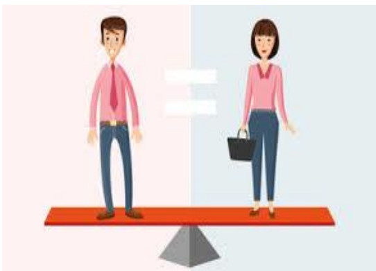
Ilustración 12 .