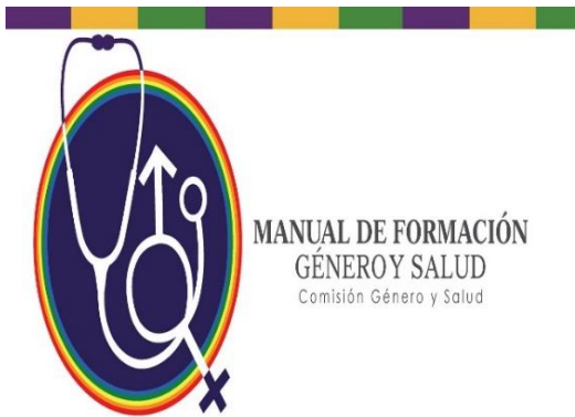
Ilustración 13 https://:oms.gob

(OMS, género y salud, 2017) Los roles son construcciones sociales que forman los comportamientos las actividades, expectativas y oportunidades que se consideran apropiadas en un determinado contexto. En el campo de la salud, el concepto y la perspectiva de género pueden ayudarnos a escuchar y comprender las diferentes necesidades y expectativas de