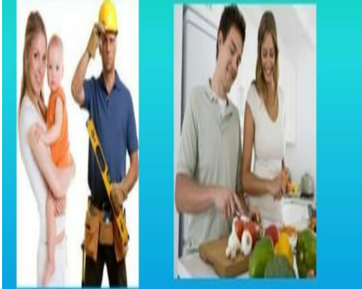
Ilustración 8 http://www.medicosdefamilia.com

(Martinez, 2019) La familia es la principal transmisora de las actitudes, valores, comportamientos y prácticas que conforman la identidad humana social y cultural. La perspectiva de género, además de distinguir entre los aspectos biológicos y sociales atribuidos a cada sexo y de hacer visible la forma como se construyen las identidades y se organizan los roles de género, destaca en el centro de su análisis: