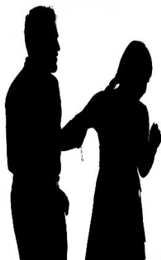
Ilustración 3 f sitio web

Desarrollar planes con visión a la reducción del machismo