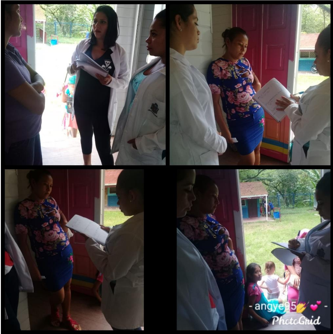
Ilustración 8