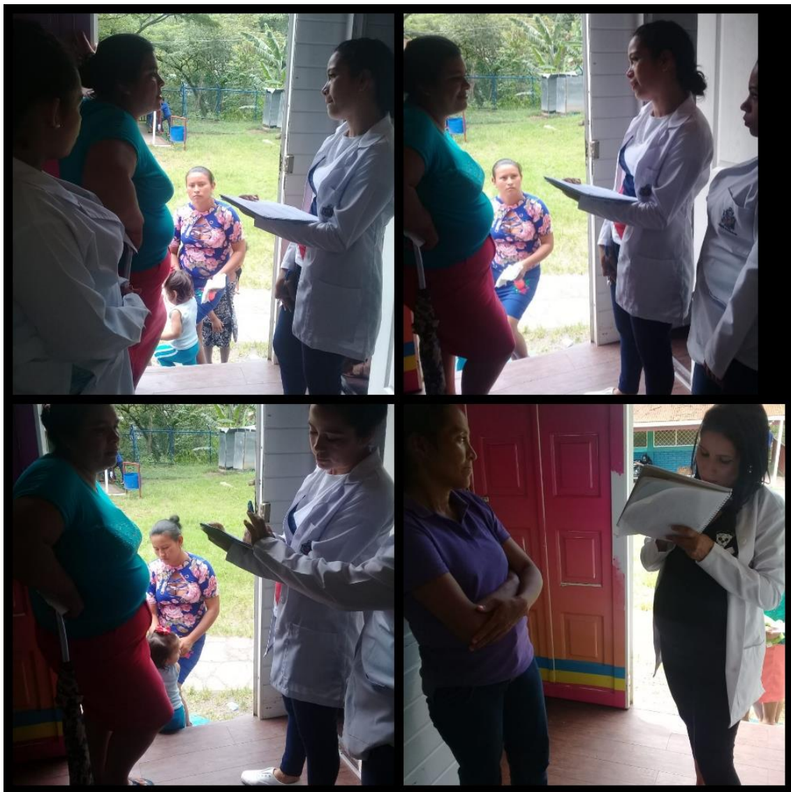
Ilustración 5 fuente propia

M9= M10=para tener apoyo y confianza en la pareja