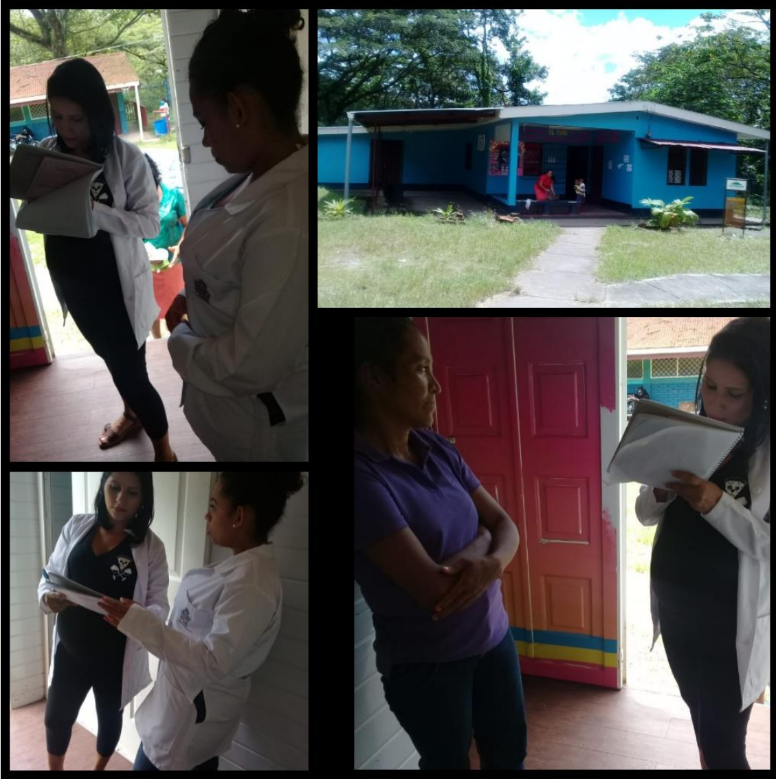
Ilustración 7