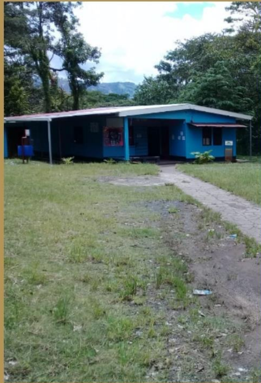
Ilustración 6