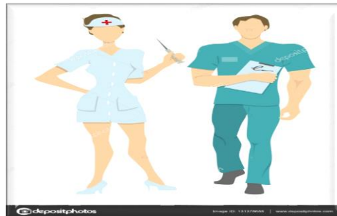
Ilustración 2 sitio web

como futuros licenciados en salud publica dialogar con el personal de salud y recordar importancia del acompañamiento conyugal en las consultas sanitarias