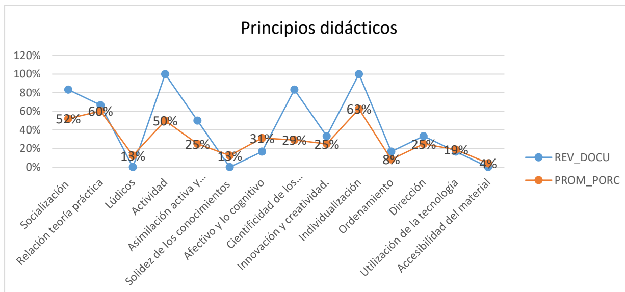
Gráfico: Principios didácticos para la construcción de ejercicios unidad de funciones matemáticas