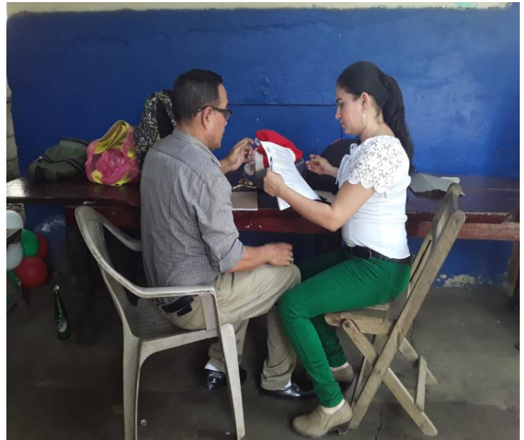
Ilustración 6 Entrevista docente de matemática.