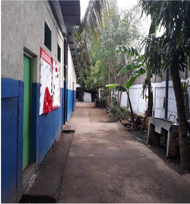
Ilustración 1 Pabellón principal Colegio Bella Sonrisa.