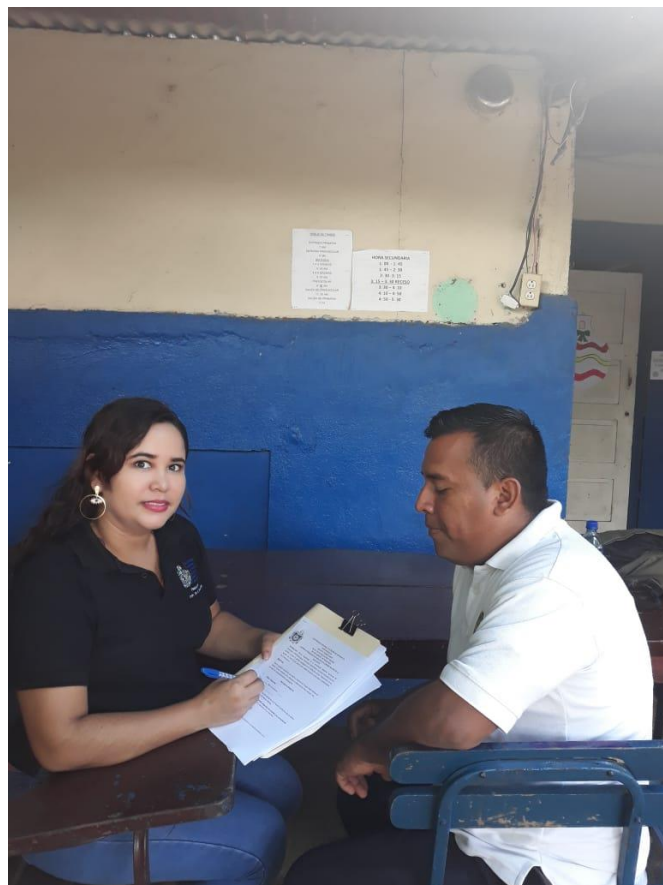
Ilustración 10 Entrevista maestro de Estudios Sociales.