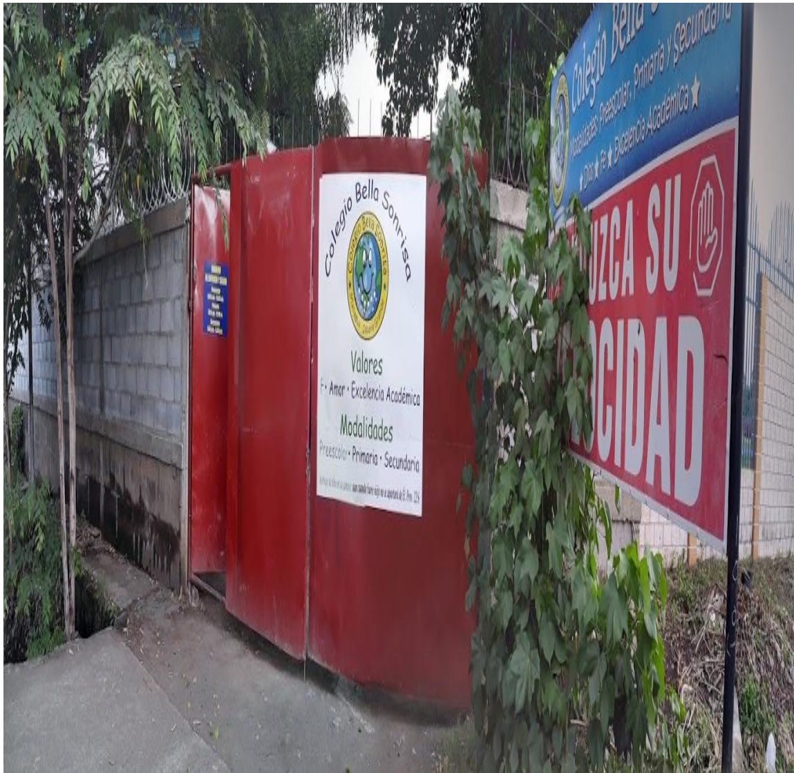
Ilustración 33 Entrada principal Colegio Bella Sonrisa.