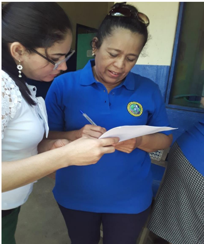
Ilustración 9 Entrevista a maestra de Educación Física.