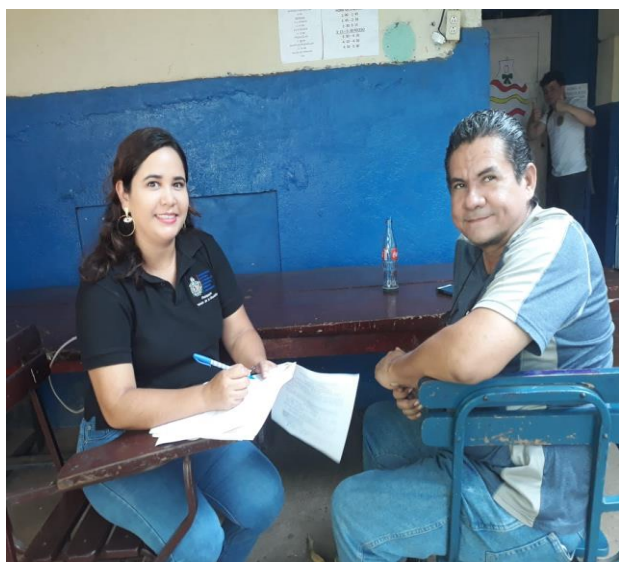
Ilustración 1 Entrevista a maestro de Inglés.