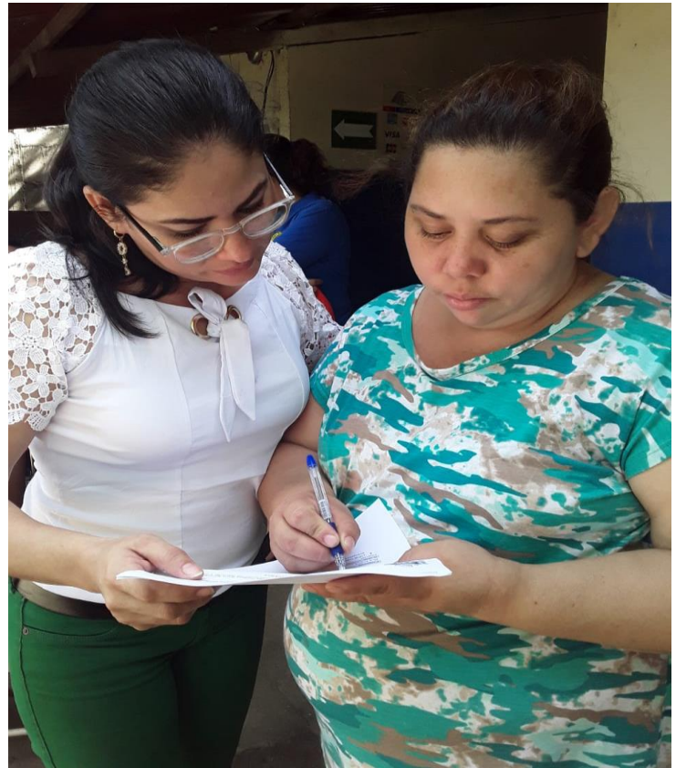
Ilustración 4 Entrevista Docente tercer nivel de preescolar