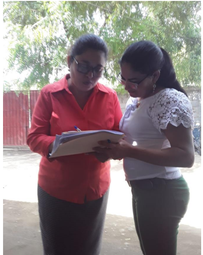
Ilustración 8 Entrevista a directora.