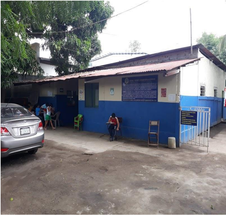
Ilustración 5 Frente de dirección del colegio.