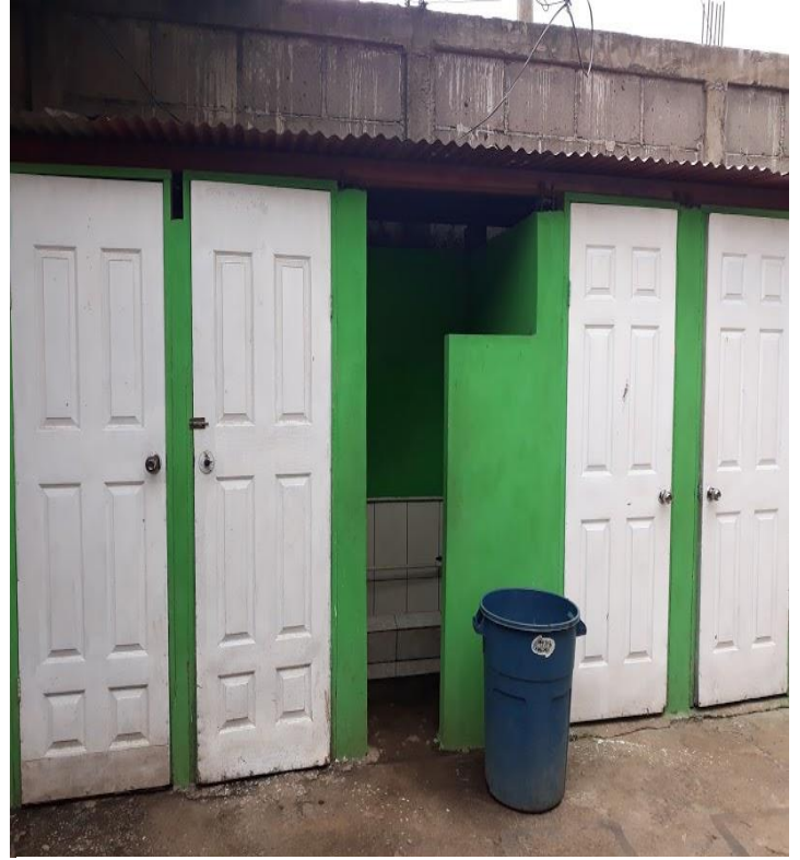
Ilustración 2 Servicios Higiénicos del Colegio Bella Sonrisa.