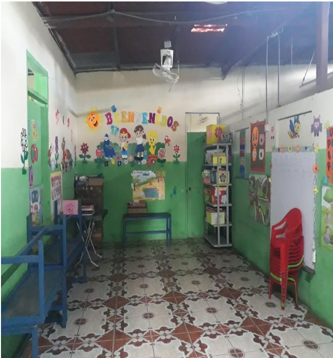
Ilustración 7 Salón de tercer nivel de preescolar.