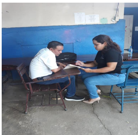
Ilustración 2 Entrevista a maestro de Matemáticas.