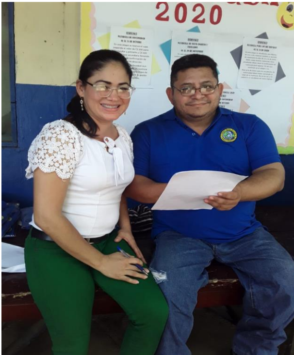
Ilustración 3 Entrevista Subdirector.