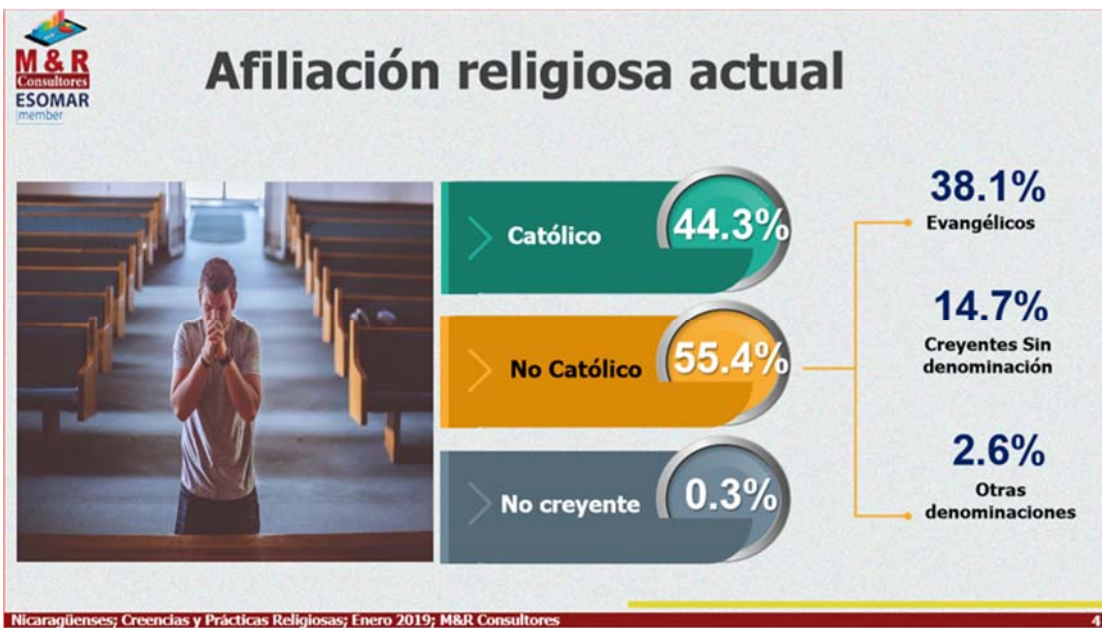
Figura # 1: Nicaragüenses; Creencias y Prácticas Religiosas; Enero 2019; M&R Consultores.