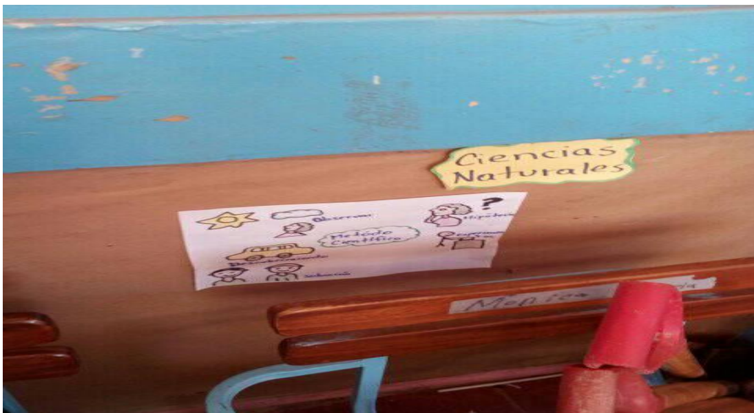
Rincón de Ciencias Naturales