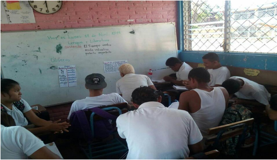
Estudiantes de III ciclo