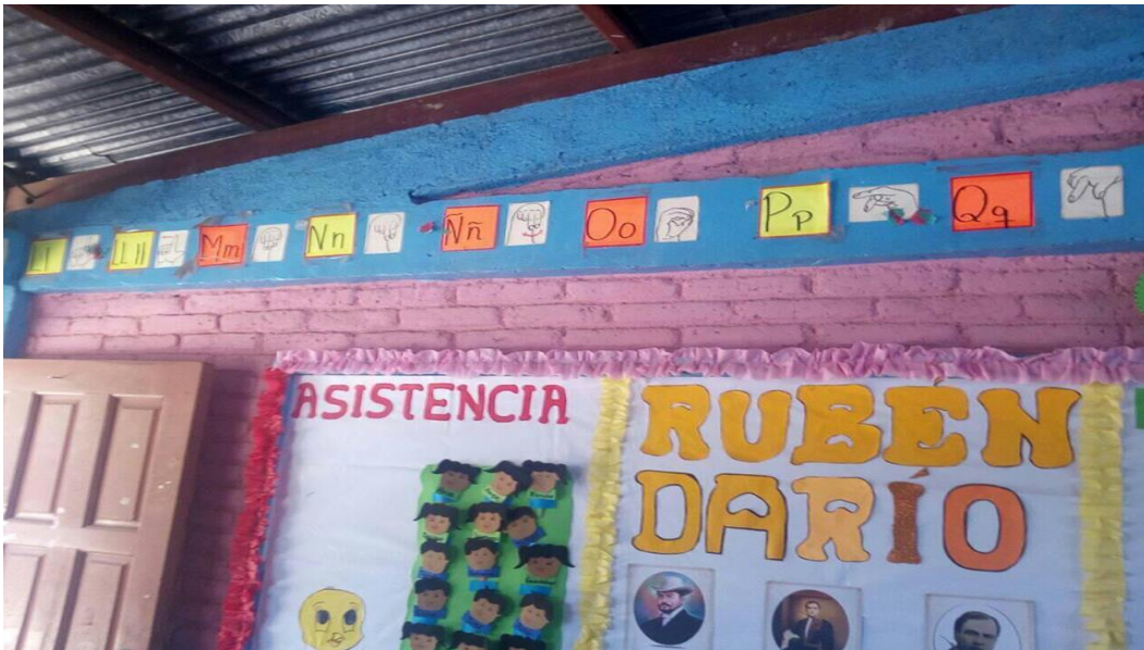
Mural aula, de III ciclo