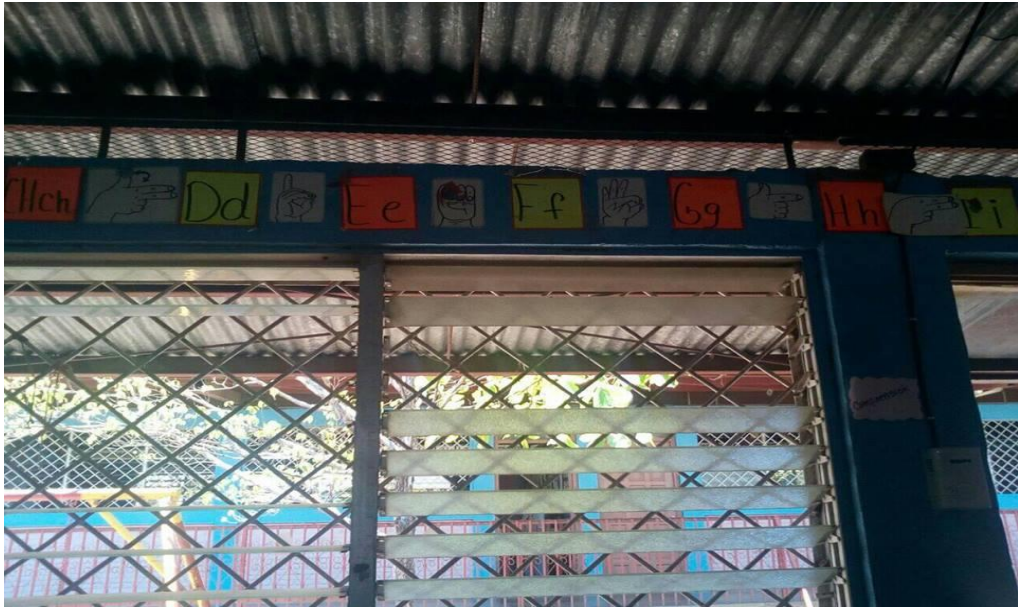
Aula de II ciclo Escuela San Vicente de Paul, Granada