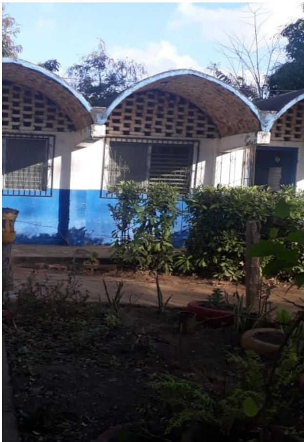
Pabellón de Preescolar, 1ro y 2do grado