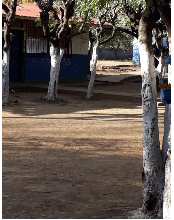
Patio en medio de pabellones 1 y 2