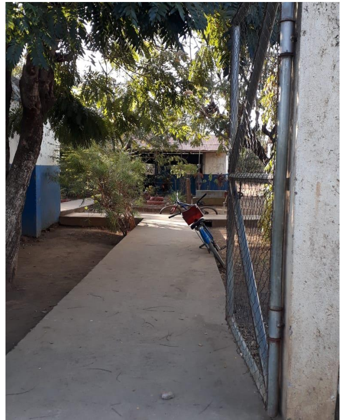
Entrada Principal Centro Escolar "Miguel Larreynaga"