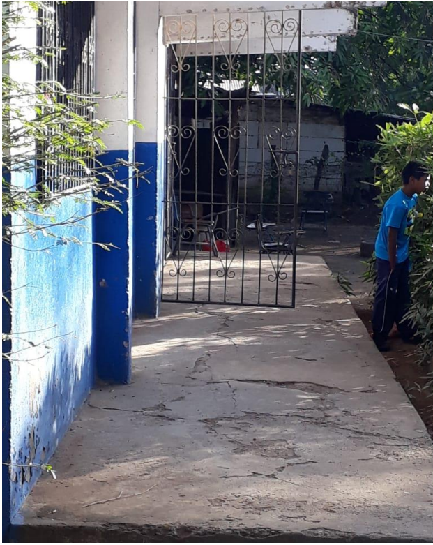
1 Pabellón de la Dirección del centro