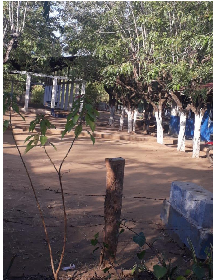
Camino al auditorio