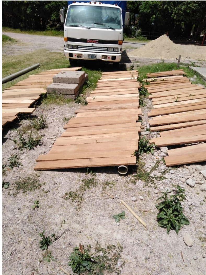
Secado de madera