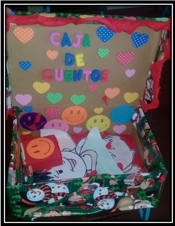
Estrategia: "Dinámica de cuentos"