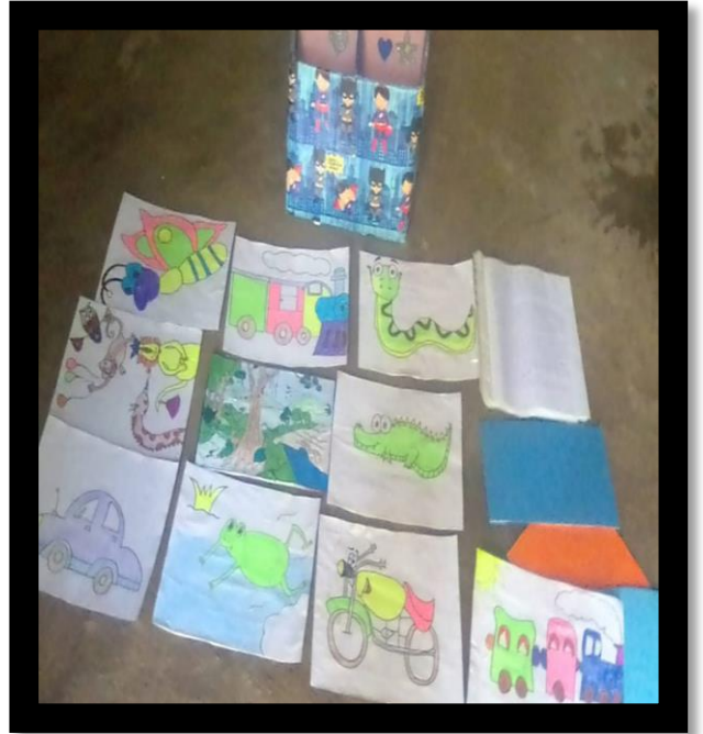
Estrategia: "Cantos ( El cocodrilo dante, El tren del Amor )"