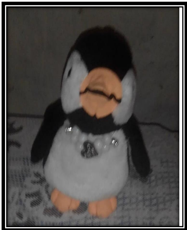
Estrategia: "Dinámica el pingüino"