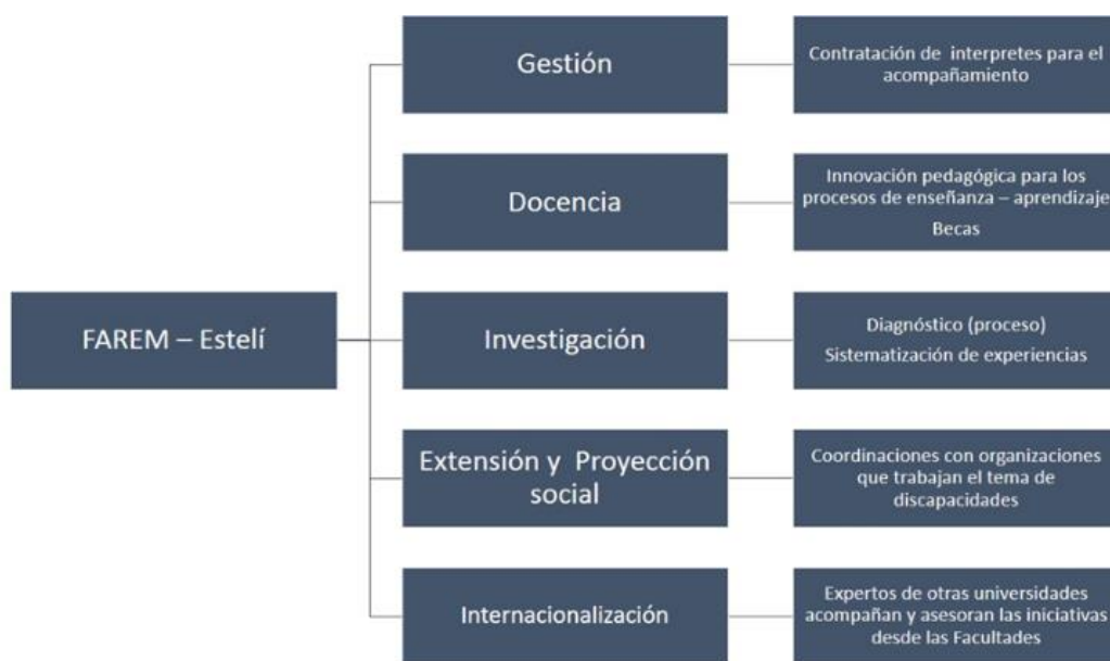
Ilustración 7 Informe de inclusión

Manzanares continua citando a BOE (2006, Artículo 71, apartado 2) ya que para el “Corresponde a las Administraciones educativas asegurar los recursos necesarios para que los estudiantes que requieran una atención educativa diferente a la ordinaria, por presentar necesidades educativas especiales, por dificultades específicas de aprendizaje, TDAH, por sus altas capacidades intelectuales, por haberse incorporado tarde al sistema educativo, o por condiciones personales o de historia escolar” (Manzanares, 2017. S.p).