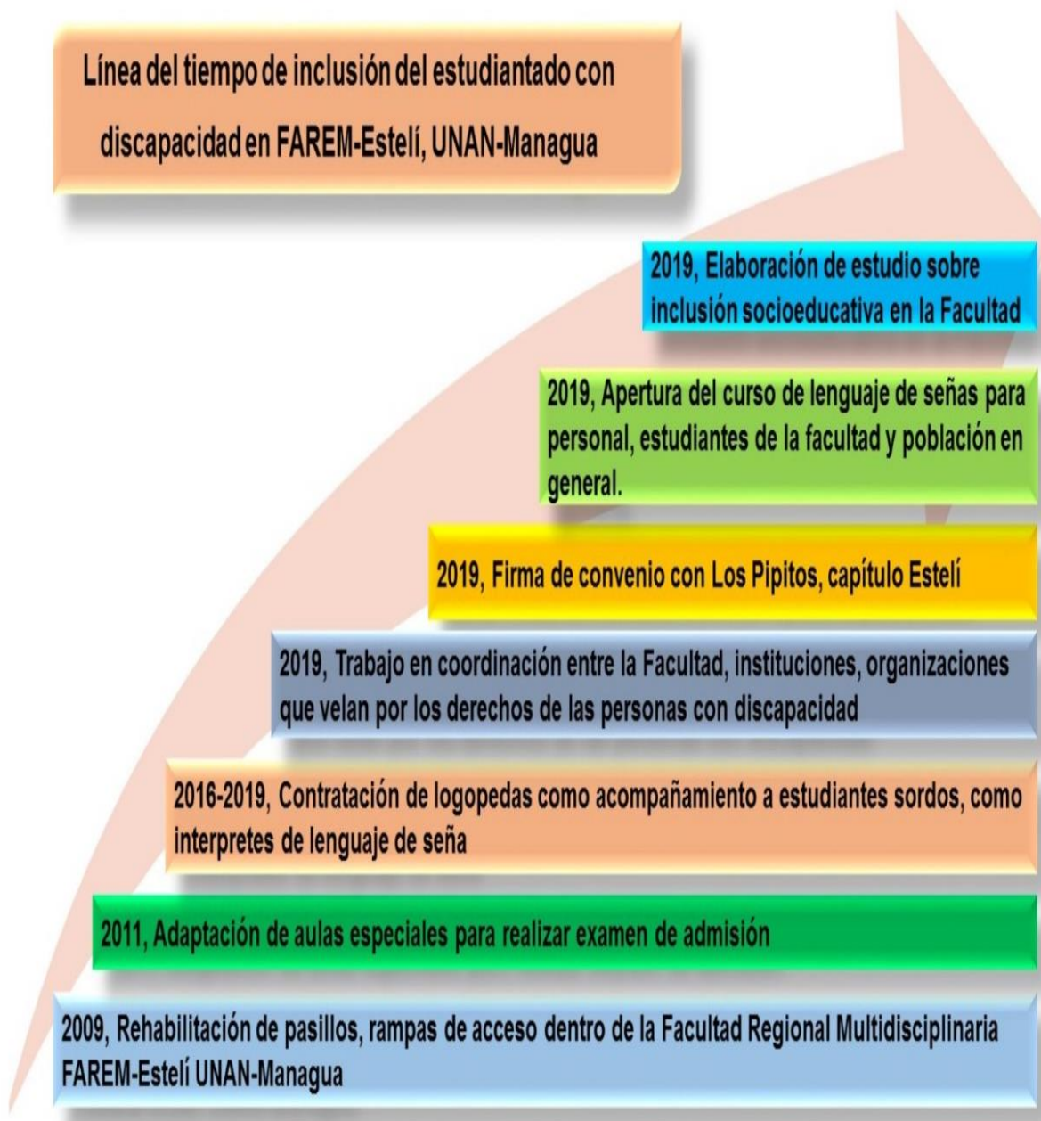
Ilustración 4. Reconstrucción de línea de tiempo inclusión de discapacidad en la Facultad

En la reconstrucción de la experiencia se construyó una línea de tiempo que contiene las diferentes acciones encaminadas a la inclusión del estudiantado con discapacidad, en intervalos de tiempo partiendo desde el año 2009, lo que permite obtener una visión sobre las estrategias implementados por la Facultad.