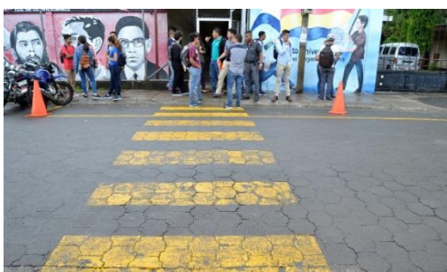
Ilustración 1. Acceso a la Facultad Regional Multidisciplinaria FAREM-ESTELI

En relación a la infraestructura de la facultad se ha venido trabajando en la accesibilidad a la institución, reduciendo las barreras arquitectónicas que obstaculizan la libre movilidad del estudiantado con discapacidad.