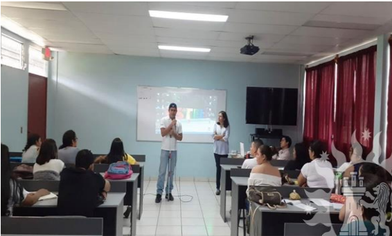
Ilustración 3 Charla sensibilización Ley Derechos Personas con Discapacidad. Estudiantes Trabajo Social. Participa estudiantes con discapacidad visual.

El proceso de inclusión se ve implicado en trascender al ámbito de la participación social de todo el estudiantado, es decir, ver hacia los sistemas relacionados con la calidad de vida en medio de todas las condiciones sociales que coexisten. Este espacio también está influenciado por los contextos no formales y formales.