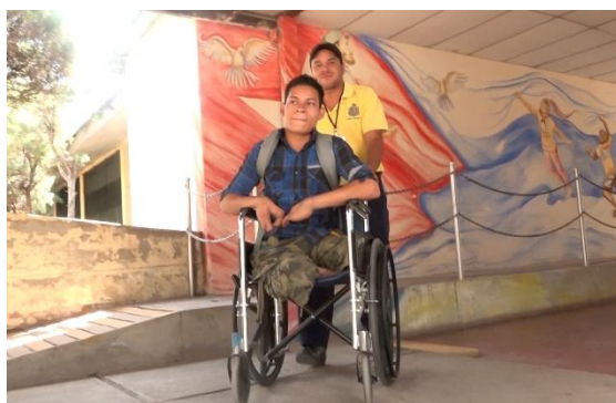
Ilustración 14 Estudiante con discapacidad Física movilizándose por la universidad apoyado por un trabajador de la Facultad

La comunidad universitaria de la Facultad esta anuente a los procesos de inclusión de los estudiantes con discapacidad, con frecuencia hay disposición para