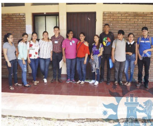
Ilustración 6 Grupo de estudiantes inclusivo

González González (2018) refiere que los retos en la educación superior aumentan conforme pasa el tiempo, debido a los cambios considerables en la sociedad; hábitos, cultura, tendencias, entre otros. Actualmente en los salones de clases hay presencia de diversos grupos, algunos vulnerables como: estudiantes de zonas rurales, indígenas, con diversidad étnica o racial, y con discapacidades (p. 3).