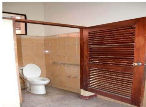
Ilustración 12. Servicios con Acceso para estudiantes con Discapacidad

Estos ajustes razonables, son una garantía inherente en la igualdad de condiciones y oportunidades para todas las personas con discapacidad, por tanto de no plantearse se evidenciaría como una discriminación y vulneración a sus derechos para que de este modo se asegure su integridad y participación al igual que las demás personas en los diferentes entornos sociales.