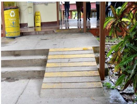
Ilustración 11. Área de acceso FAREM-Esteli