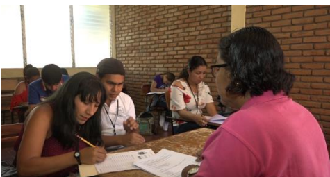
Ilustración 9. Intérprete acompañando a estudiante en situación de discapacidad a realizar el examen de admisión

Según el argumento de la docente de matemática general hay tres elementos que apuntan al proceso de inclusión, (1) la accesibilidad, regida por el proceso inicial de inclusión y el fácil acceso a estudios en el centro universitario, (2) el sistema de apoyo, contemplando las metodologías y estrategias personales y grupales de inclusión socioeducativa, (3) los espacios de participación, siendo los de mayor necesidad y que en la actualidad son el centro de trabajo por la comunidad educativa para generar una verdadera inclusión educativa.