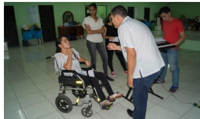
Ilustración 2 Adolescente integrante del Grupo Cenzontle Latino FAREM-Estelí

Los estudiantes integrados en la Facultad; participan de acuerdo a sus intereses en prácticas deportivas como taekwondo, softbol y prácticas culturales de música y danza (Suarez , 2019, p. 7).