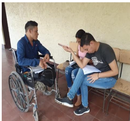
Ilustración 5. Trabajo de Recolección de Información

Según el Plan de Desarrollo Humano 2009-2011 entre sus objetivos esta implementar la educación inclusiva como derecho de los niñas y niños con discapacidad diferentes, en centros de educación especial y centros educativos regulares; así mismo la política de salud ha definido como prioritarios a las personas con discapacidad, brindando atención médica gratuita, humanizada y de calidad desde los centros de salud y hospitales y la atención medica ambulatoria desde el programa todos con voz (GRUN, 2009, p. 9).