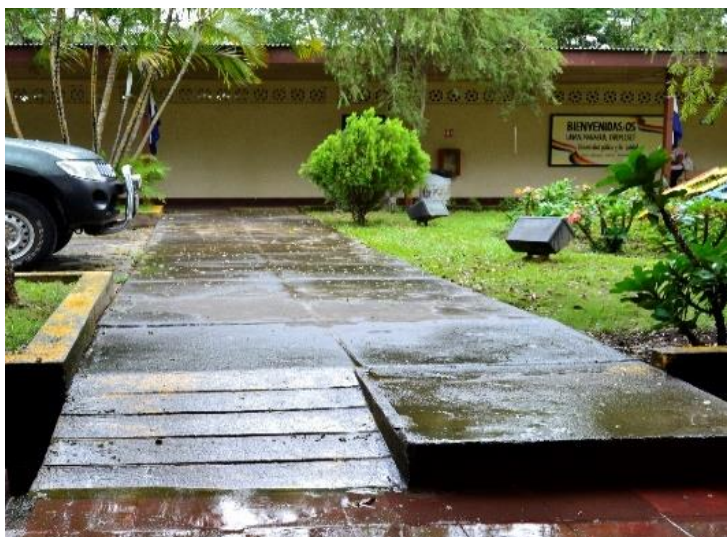
Ilustración 8. Vía de acceso pabellón 1 FAREM-Estelí

Concluimos que existen estrategias de Inclusión personales, grupales e Institucionales de las cuales algunas de ellas se realizan de manera aislada, es decir se incluye al estudiante pero se trabaja por separado. Otras sin embargo se han venido trabajando de manera conjunta con la comunidad universitaria, pero no son las suficientes para lograr no solo la inclusión sino la integración.