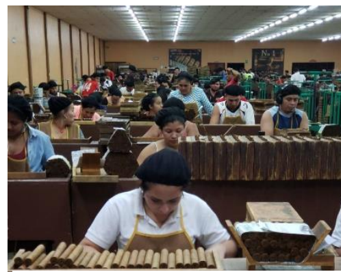
Ilustración, Fuente propia, Salón de producción de fábrica tabacalera

Oportunidades para prácticas , algunas de las estudiantes expresan que su centro de trabajo les brinda la posibilidad de realizar la practicas académicas en las áreas de la fábrica acorde a la carrera que estudian, ya sea en el área administrativa o recursos humanos, además algunas cuentan con preescolares lo que posibilita realizar prácticas a las carreras afines a la docencia.