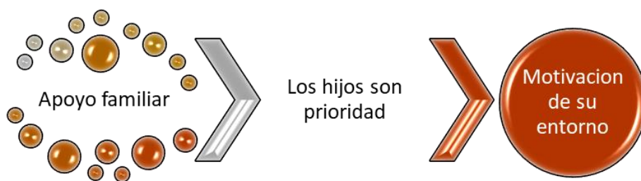
Ilustración: Estrategias familiares de mujeres estudiantes y trabajadoras.

Las protagonistas clasifican como estrategias claves para su desarrollo: