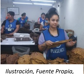
Ilustración, Fuente Propia, Mujeres Trabajadoras de Fábrica de Tabaco en el área de Pre- Industria