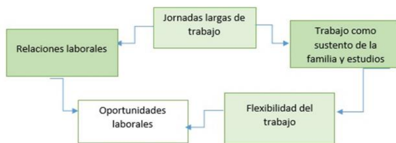
Ilustración: Fuente Propia. Estrategias laborales de mujeres estudiantes y trabajadoras

Estrategias laborales , las mujeres estudiantes mencionan que utilizan estrategias para el rendimiento laboral, educativo, y así obtener mejores ingresos y la oportunidad de continuar con sus estudios.