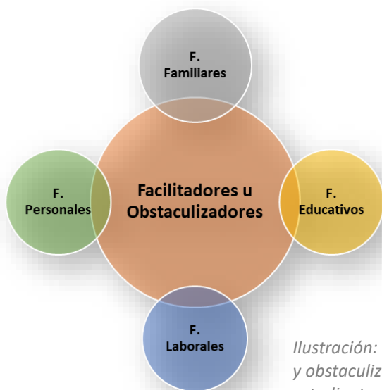
Ilustración: Factores Facilitadores y obstaculizadores de mujeres trabajadoras y estudiantes

Al abordar los factores facilitadores u obstaculizadores para las mujeres trabajadoras en las fábricas de tabaco como estudiantes en su carrera universitaria, se encontraron, clasificándolos en: