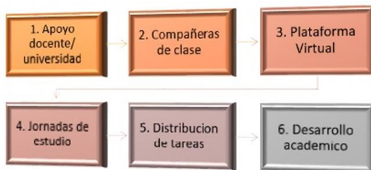
Ilustración: Fuente Propia. Estrategias educativas que implementan mujeres estudiantes y trabajadoras

Estrategias educativas: en este apartado describe las acciones que las mujeres estudiantes utilizan para poder cumplir con las exigencias de los docentes y del centro de estudio. Estas acciones las han puesto en marcha y que les ha ayudado en gran manera para mantenerse enfocadas en sus sueños y aspiraciones profesionales y están ligadas a su vida familiar y laboral.