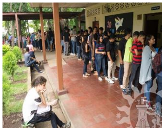
Ilustración Fuente FAREM, Estelí, Entrega de becas académicas a estudiantes

La lucha estudiantil para hacer valer el derecho al 6%, ha sido fundamental para la eficacia y vigencia del artículo 125 de la Constitución Política de Nicaragua en que se reconoce plenamente el derecho de los nicaragüenses a la educación gratuita, lo que constituye una reivindicación social alcanzada por el pueblo como resultado de su lucha heroica en pro de una patria democrática, participativa y representativa (Universidad Nacional Autónoma de Nicaragua UNAN- Managua, 2017,p.4).