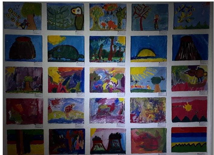
Pinturas elaboradas por Niñez participante de FUNARTE

“Transmiten educación social, política y cultural” (Entrevista población).