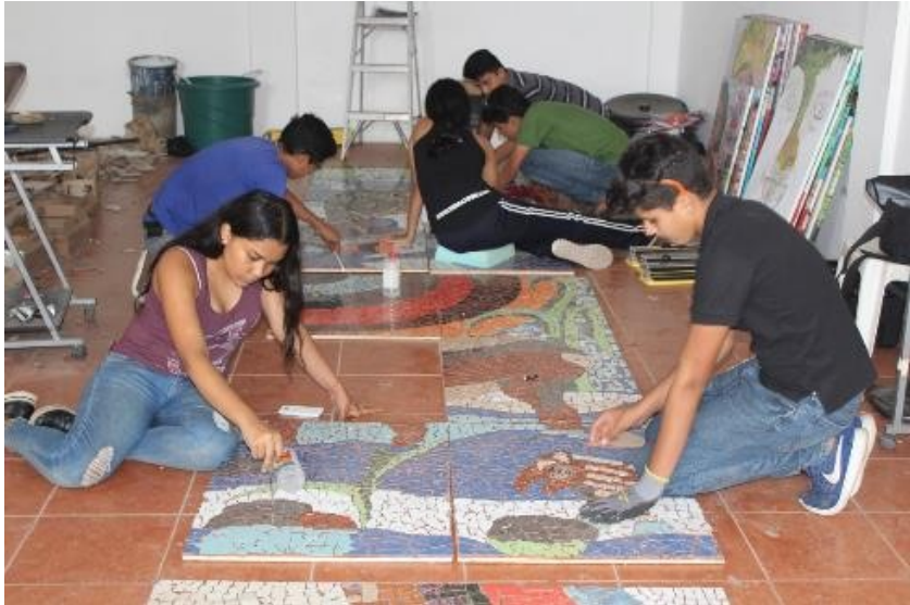
Niñas, niños y adolescentes elaboran mural con material de reciclaje (Cerámica

“ ...a través del muralismo se plasman problemas sociales que hay y que ha habido a través de la historia, también en la ciudad de Estelí tenemos murales que expresan mensajes alusivos al medio ambiente, la protección a la flora y fauna, donde se elaboraron muchos murales de material reciclado, como de tapones de botellas de vidrio, entonces todo esto nos lleva a una expresión que quieren aportar los niños, como por ejemplo, reusar, reutilizar cosas, aportando al medio ambiente, hay otros murales que son de educación, de inclusión de personas con discapacidad que sean incluidas en diferentes programas de nuestra sociedad” (Coordinadora Juventud Sandinista).