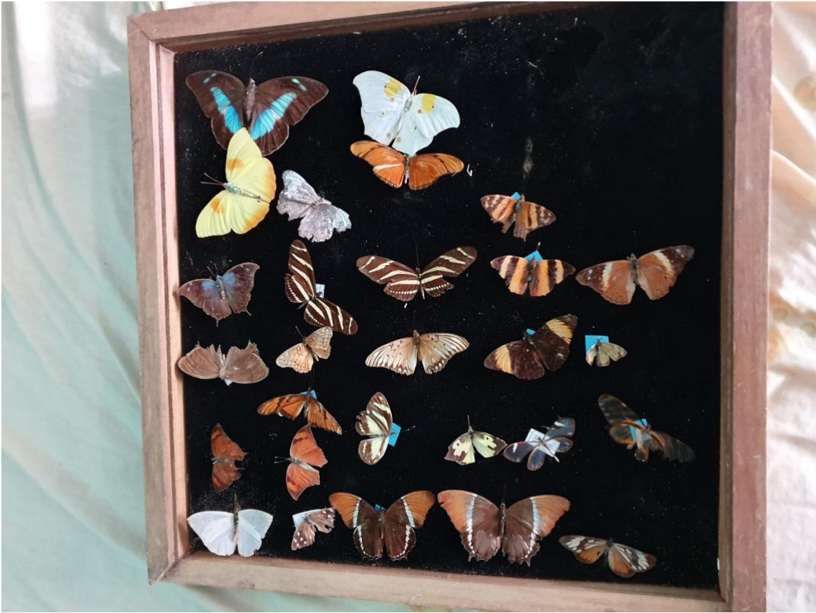
Elaboración del instrumento caja Entomológica